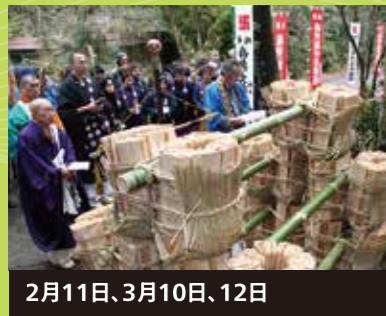
2月11日、3月10日、12日 伊賀一ノ井 松明調進行事 770年以上続く、東大寺二月堂のお水取りに使う松明を調整・法要・寄進する伝統行事。