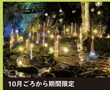
10月ごろから期間限定 赤目溪谷 幽玄の竹あかり 趣向を凝らしたデザインの竹あかりが、夜の赤目溪谷を幻想的に照らします。