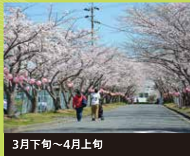
3月下旬～4月上旬 名張桜まつり 桜のトンネルが美しい名張中央公園。歩行者天国となり、イベントも開催されます。