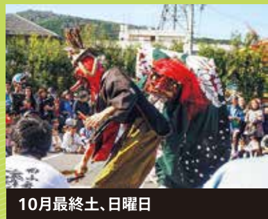
10月最終土、日曜日 名張秋まつり 町内にみこしやだんじり、ふとん台などが練り出し、宵宮には獅子舞の奉納などもあります。