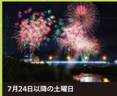
7月24日以降の土曜日 名張川納涼花火大会 名張の夏の風物詩。名張川河畔で仕掛け花火やスターマインが夜空を彩ります。