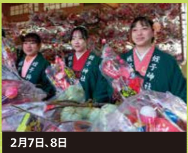
2月7日、8日 八日戎 蛭子神社で行われる約350年続く祭り。七福神の舞の奉納、はまぐり市などが行われます。