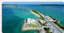
海の駅あやはし館 (3)