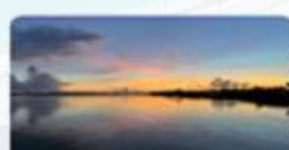
一期一会に彩られる黄昏時の空と海 (平安座島)