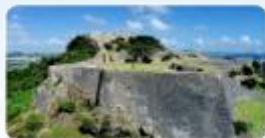
世界遺産勝連城跡 (4)