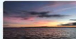
一期一会に彩られる黄昏時の空と海(2) (平安座島)