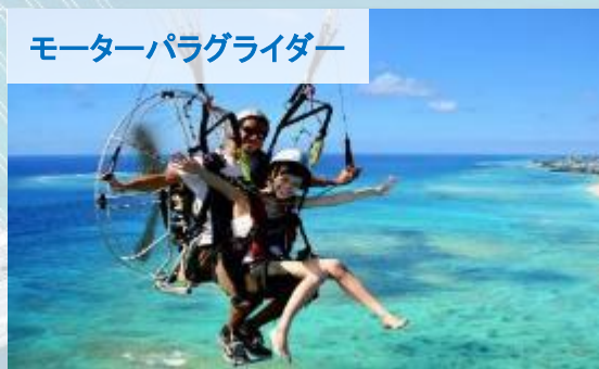
モーターパラグライダー