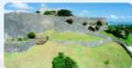
世界遺産勝連城跡 (3)