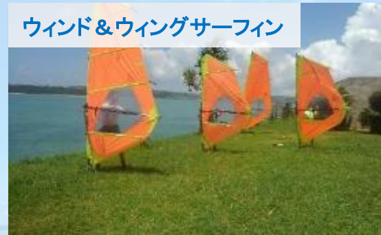
ウィンド&ウイングサーフィン