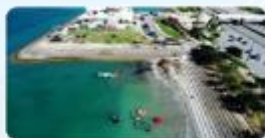
海の駅あやはし館 (4)