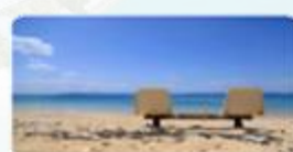
特写座 (トツマイ浜)