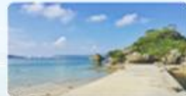
アマミチユーの草 (4)