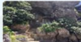
アマミチユーの草 (5)