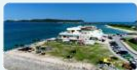
海の駅あやはし館 (1)