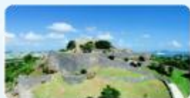
世界遺産勝連城跡 (1)