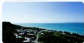
世界遺産勝連城跡 (5)

「うるま市の自然や伝統文化、観光地」などの魅力をPRする目的で、当協会公式ホームページにて、画像・動画の素材を掲載しております。是非ご活用ください。