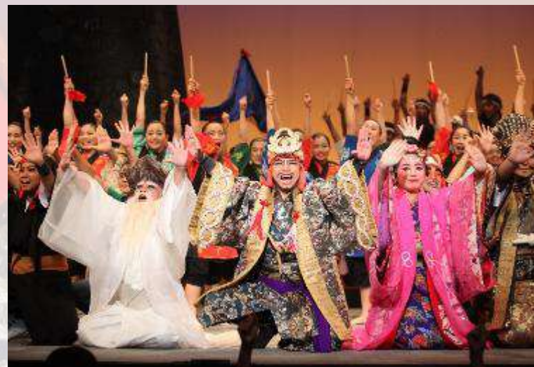
「勝連城と阿麻和利の物語」を歌と踊りで表現