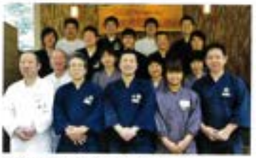
スタッフが心を合わせて笑顔のおもてなし。