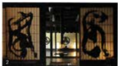
1)歴史的にも価値がある古民家は昔そのままの外観ながら、内部は快適に過ごせる工夫が施されています。2)板張りの床に二つのいりり、日本の魂を伝えるような美しいたたずまいです。3)東洋文化研究者アレックス・カー氏、日本文化に関する著書も多く、景観と古民家の再生に取り組みコンサルティングを行うほか全国で講演会活動を展開しています。