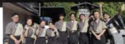
楽しい思い出を作っていただけじゃなく、スタッフ全員でおもてなしいたします。