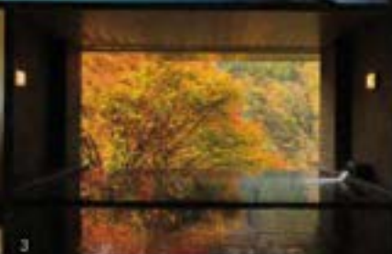
1)ケーブルカーを下った先には、源泉かけ流しの露天風呂。2)山を眺めながら寛いでひと休み。3)移り行く四季の絶景を堪能するインフィニティ温泉。4)深谷に吹く風に揺れる「イワツツジ」がデザインされたシン・ケーブルカー。