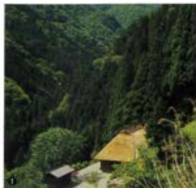
1)日本のチベットとも呼ばれる貴重な山岳風景に囲まれた宿。2)窓には四季折々の山並みが広がります。3)国選定重要伝統的建造物群保存地区「落合集落」。