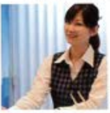
スタッフは心を込めた笑顔で対応します。

「サンリバー大歩危」は、剣山国定公園内の奇勝、大歩危・小歩危に位置する安らぎの宿。小歩危峡は西日本一の激流といわれ、客室や大浴場からは、スリルあふれる深谷を見下ろすことができます。湯の質は化膿水いらすの湯といわれ、美肌効果のある強アルカリ泉。ホテルは小歩危峡を走る列車の撮影ポイントとしても有名で、著名な鉄道愛好家がプロデュースした「鉄道ルーム」は鉄道のビューポイントでもあります。露天風呂付きの和室は、部屋から見える自然の景観や落ち着いた内装が人気。部屋の広さは、少人数から大人数までご希望をかえることができます。電気自動車のEV充電機も設置するなど、幅広い皆様のニーズにお応えします。