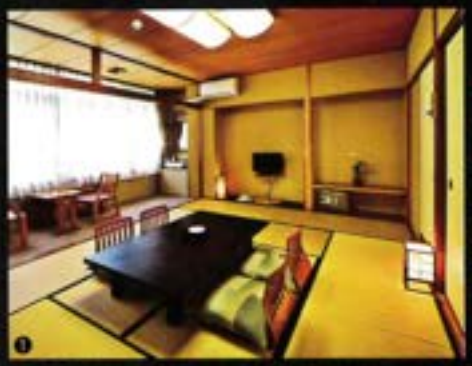
1)落ち着いた内装の和室は、外国人旅行者に人気。2)大自然に囲まれた客室からは、小歩危峡が一瞥できます。3)「鉄道ルーム」と呼ばれる和室は、鉄道ファン垂涎の撮影ポイント。4)対岸の山々が迫る、大歩危小歩危を見下ろす絶景露天風呂。