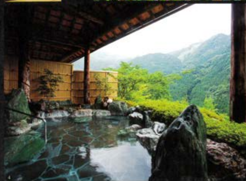
1)展望風呂付きの特別室。2)趣のある囲炉裏で、山並みの眺めが味わえます。3)天空の露天風呂へは山小屋風の専用ケーブルカーで。4)湯気の音を仰ぎ、雲海を見下ろす、ホテル自慢の「天空露天風呂」。