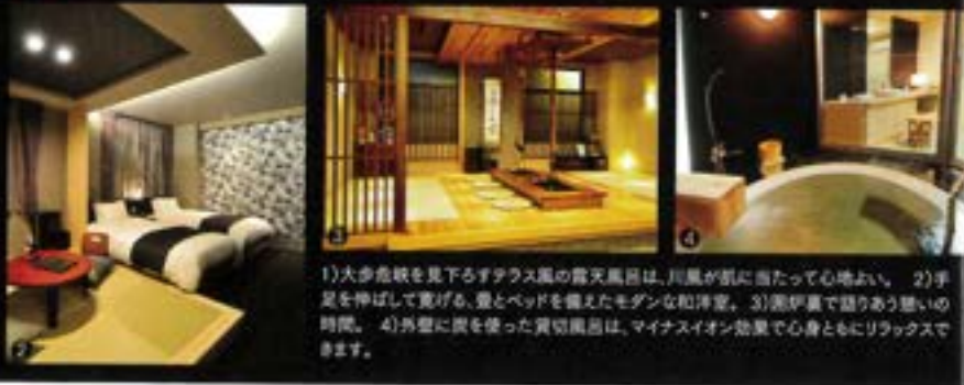
1)大歩危を見下ろすテラス風の露天風呂は、川風が肌当たって心地よい。2)手足を伸ばして寛げる、畳とベッドを備えたモダンな和洋室。3)湯伊集で語りあう憩いの時間。4)外壁に炭を使った貫切風呂は、マイナスイオン効果で心身ともにリラックスできます。