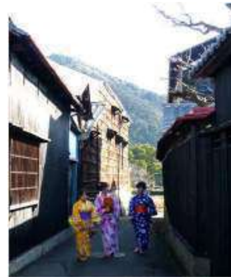
浴衣体験での散策