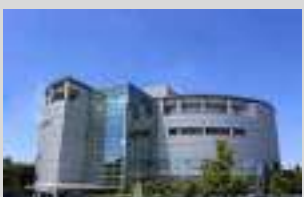
ぎふ清流文化プラザ

専門的な検力測定やトレーニングを科学で追求する。スポーツ科学と研究の拠点。宿泊施設も併設されています。