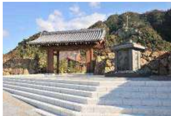
岐阜公園の正門・冠木門と若き織田信長公の彫像