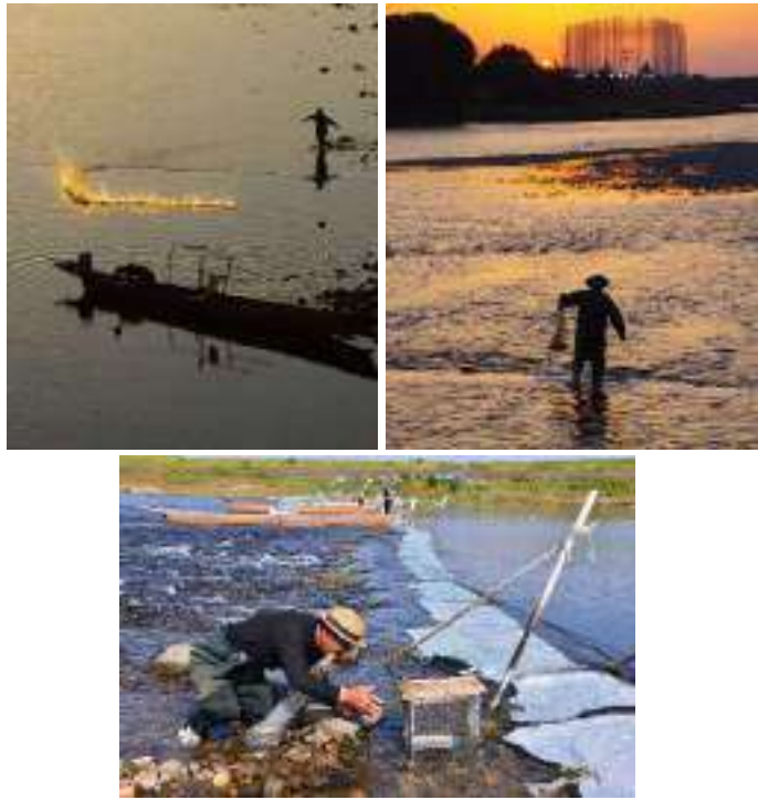
「清流長良川の鮎」が「世界農業遺産」に認定！