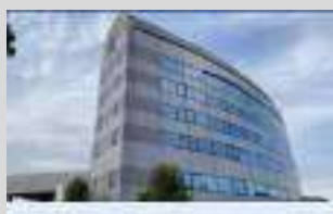
岐阜県長良川スポーツプラザ

専門的な検力測定やトレーニングを科学で追求する。スポーツ科学と研究の拠点。宿泊施設も併設されています。