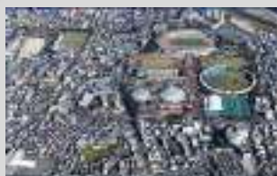
岐阜メモリアルセンター

https://www.gifucvb.or.jp/convention/support.php