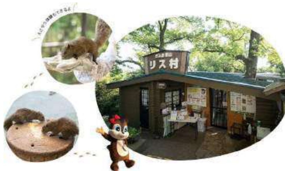
ぎふ金華山リス村

【公式】長良川温泉十八楼 | 岐阜県の老舗旅館 | ベストレート保証 (18rou.com)