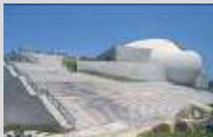
長良川国際会議場

Jリーグ、プロ野球、陸上競技などのスポーツ、見本市を開催できる施設。産業イベントの拠点。