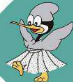
ぎふ長良川の鶴飼 『うーたん』