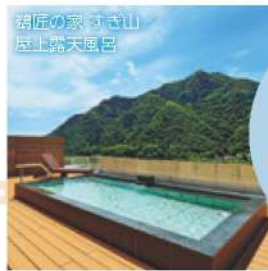
羽匠の家 すぎ山 歴史的な温泉