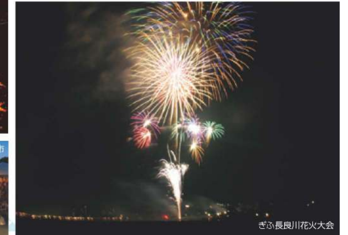
ぎふ長良川花火大会