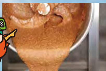
厳選した素材のみで丁寧に作られる