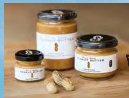
人気 No.1 の「ピーナッツバター (粒あり)」 (左から28g / 530円、240g / 2,690円、110g / 1,590円)