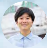
NAA 広報部 中村

表紙デザインやイラストのリニューアルを行って初めての発行となる今号では、成田空港内保育ルーム「たんぽぽ」の園児と保育士の皆さんにご出演いただきました。今年4月にリニューアルオープンした第1ターミナルの展望デッキで、「がんばれー！」と手を振りながら離陸する飛行機を見送る園児たちの姿に、とても和やかな気持ちになりました。