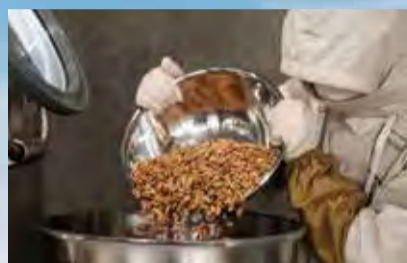
落花生は選別し、良い豆のみを使用