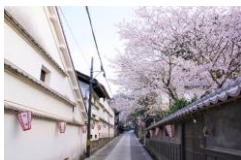
上町地区のまちなみ