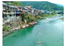
池川地区まちあるき