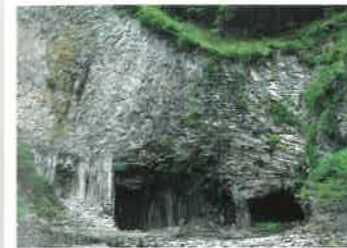
8 玄武洞 (げんぶどう) 玄武洞は兵庫県豊岡市の円山川東岸にある洞窟・絶壁で、国の天然記念物に指定されており、約160万年前に起こった火山活動によりできた玄武岩の美しい柱状節理や板状節理を見ることができます。