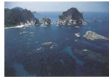
2 浦富海岸 (うらどめかいがん) 浦富海岸は駒馳山から陸上岬に至る岩美町の海岸の総称。全長15kmの岩石海岸で、断崖絶壁と松を抱いた大小の島々や岬に囲まれた白砂の浜が広がる“白砂青松”の景勝地。『浦富八景』と称賛されています。