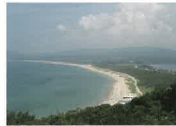
10 小天橋 (しょうてんきょう) 小天橋は木津川河口～久美浜湾口の美しい砂丘地帯で、京都の自然200選に選ばれています。久美浜湾と外海を分ける砂洲は、その地形が天橋立に似ていることから「小天橋」と呼ばれるようになりました。