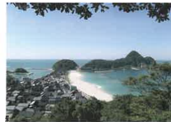
7 竹野浜 (たけのはま) 竹野浜は豊岡市竹野町にある東西約800mの遺浅の砂浜で、透明度が高く、快水浴場百選をはじめ、日本の渚100選、日本の水浴場55選、日本の水浴場88選などにも選ばれる日本を代表する海水浴場の一つです。