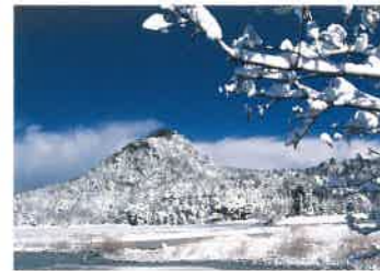
11 兜山 (かぶとやま) 兜山は標高192m。流紋岩の火山岩からできている、鐘型または兜状の秀麗な山容をなしています。山全体が山陰海岸国立公園の特別地域に指定され、豊かな自然風景が守られており、山頂には熊野神社が奉られています。