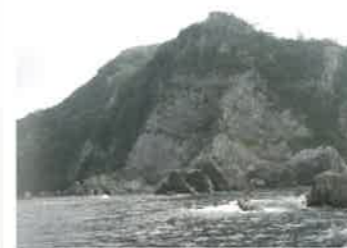
4 鎧の袖 (よろいのそで) 鎧の袖は香住海岸の西部に位置する高さ65m・長さ200m、傾斜角70度での切り立った大海食崖で、国の天然記念物に指定されています。柱状節理と板状節理が交わり、鎧のおどしにみえることから名付けられました。