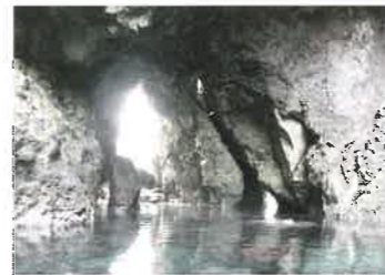
5 淀の洞門 (よどのどうもん) 淀の洞門は竹野海岸切浜の黒崎鼻の北端にある高さ18m、奥行き40mの海食洞。火山活動によって生成された凝灰角礫岩の亀裂を波が侵食して出来た亀裂洞門で、洞門内には潮の干満により海水が流れ込みます。