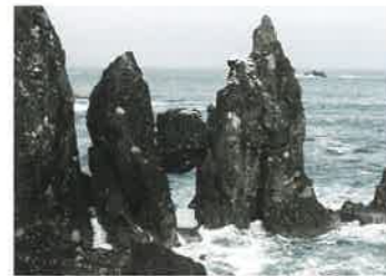
6 はさかり岩 (はさかりいわ) はさかり岩は竹野海岸切浜の波食岩礁地帯の海岸線に位置し、礫岩の地層にそってできた洞門。海食洞の天井の岩が落ちて洞側壁の岩に挟まってできたと考えられ、兵庫県の名勝に指定されています。