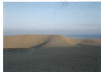
1 鳥取砂丘 (とっとりさきゅう) 鳥取砂丘は東西16km、南北2.4kmに広がる日本最大級の砂丘で、風紋やスリパチなど起伏に富んだ内陸的砂丘景観を呈し、中国山地から流れ出した土砂が水と風の力により運ばれてきた日本を代表する地形です。

地質は、新生代新第三紀における日本海拡大の断裂に伴って噴出した玄武岩・安山岩・流紋岩等の火山岩（節理の発達したものが各所に見られる）や火山砕屑岩と礫岩・砂岩・泥岩等の堆積岩を主とし、その基盤として中生代白亜紀末～新生代古第三紀前期の花崗岩も見られる。このような岩石が作り出す地層の重なり、不整合、岩脈、節理などの多様な産状や地質構造が観察され、またその特異な地形が随所で見られることから「地質の公園」、「海岸美の公園」とも呼ばれている。