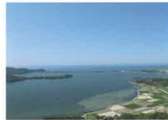
9 久美浜湾 (くみはまわん) 久美浜湾は湖沼型の湾で湖岸延長約28km、湊地区大向水道（幅約50m）で日本海とつながっており、約160万年前に起こった火山活動によりできた玄武岩の美しい柱状節理や板状節理を見ることができます。