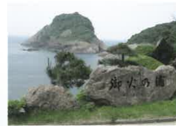
3 但馬御火浦 (たじまみほのうら) 但馬御火浦は香美町の伊笹岬から新温泉町の観音山まで約8kmの岩礁海岸で、国の名勝及び天然記念物に指定されており、日本海の荒波により彫刻された断崖絶壁、数多くの洞門や洞穴が形成されています。