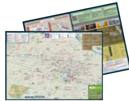
デジタル観光ガイドブック (日英併記)