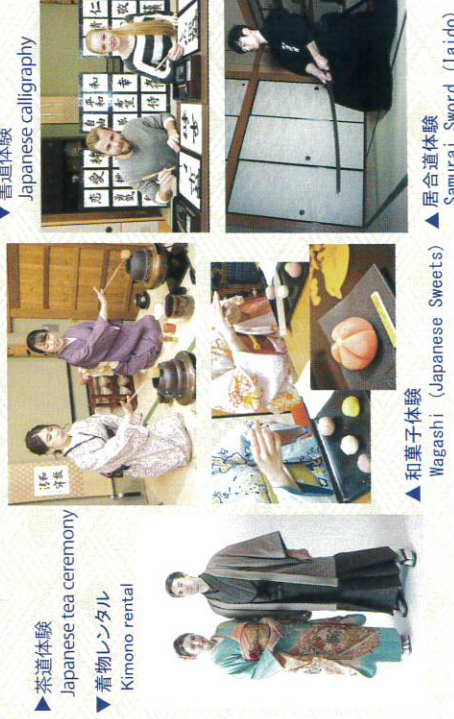
茶道体験 Japanese tea ceremony 着物レンタル Kimono rental 書道体験 Japanese calligraphy 和菓子体験 Wagashi (Japanese Sweets) 居合道体験 Samurai Sword (Iaido)

KIMONO RENTAL JAPANESE CULTURE EXPERIENCE