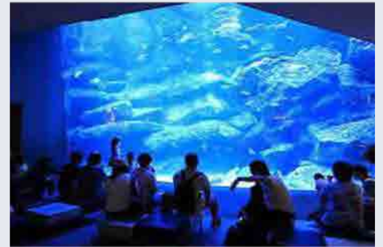
水槽前にソファーを設置。照明、楽曲、アロマなどにより居心地の良い空間をデザインしている。