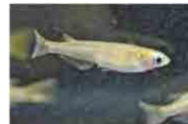
メダカの学校プロジェクト

かつて東京に生息していた絶滅危惧種や希少な水棲生物を、種を絶やさないために各種機関と協力しながら保全活動に取り組んでいます。