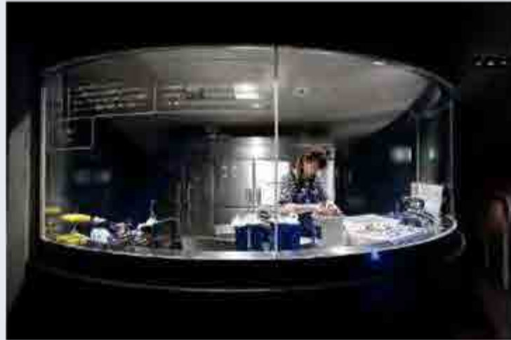
本来はバックヤードで行う飼育作業も見せることでいきものと向き合う飼育スタッフの姿勢も伝える