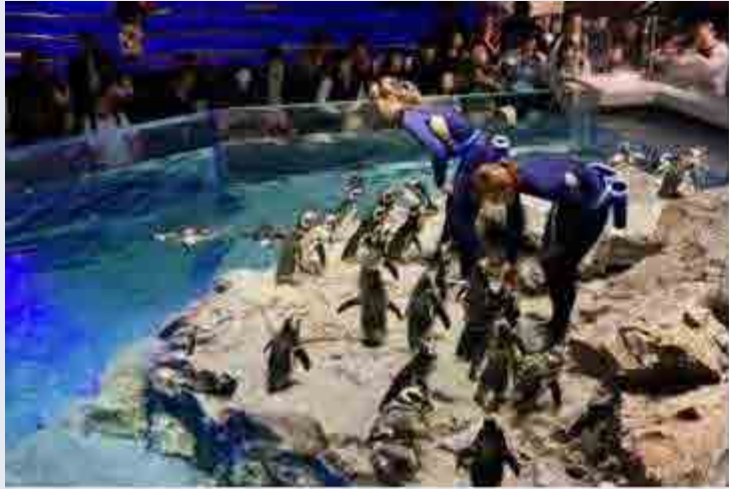
国内最大の屋内開放型ペンギンプール、ビクシャールなどお客さまといきものの距離を極力近づけた展示空間