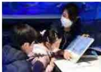
すみだっ子たちの夢支援プロジェクト

地域のコミュニティの一員として、行政や地域住民と一緒に、子どもたちの夢や悩みに寄り添い、感性を育む取り組みをしています。