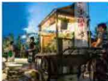
東京金魚プロジェクトのようす

東京には、かつて金魚の養魚場がたくさんあり、多くの家で金魚は家族の一員でした。「東京金魚プロジェクト」は東京の金魚文化を未来につなぐことを目的としています。