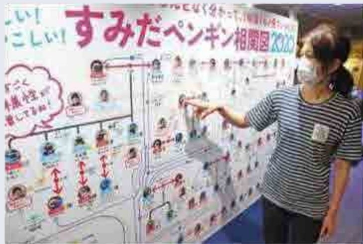
「ペンギン相関図」など、生態情報だけでなく、いきものたちの個性を伝え、愛情を伝える