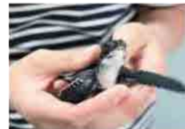
アオウミガメ保全活動

世界自然遺産・小笠原諸島の海を表現した常設の展示による普及啓蒙活動や、絶滅の危機にあるアオウミガメの保全活動も小笠原村と提携して行っています。