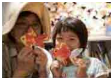
体験プログラム「きんぎょ色あわせ」

楽しみながら環境問題への気づきや、視野を広げる想像力を養うきっかけづくりを目的とした体験プログラムを実施しています。