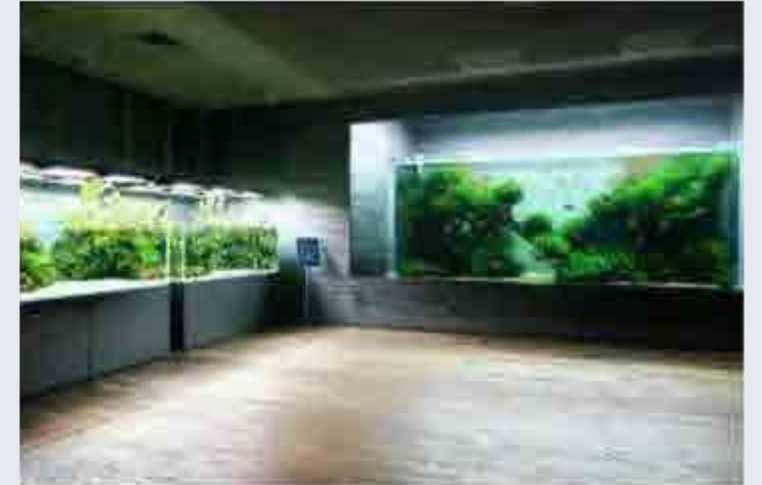
アクアデザインアmanoの制作・管理する、世界に3か所しかない常設のネイチャーアクアリウム。自然の循環を表現。