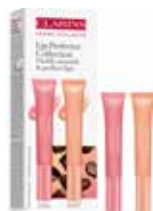
CLARINS インスタント・ライト・ナチュラル リップ パーフェクターデュオ 2 x 12ml 32,90 €