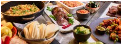
グランド・ビュッフェ デッキ6 北欧料理をはじめとした国際料理のビュッフェ形式レストラン テーブル予約が必要です。(受付時間15:30~) ご朝食ビュッフェは朝からご提供しております。