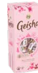
KARL FAZER ゲイシャ ミルクチョコレート 420g 10,90 €