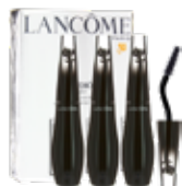
LANCÔME グランディオーズ マスカラ トリオ 97,90 €