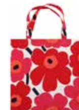
MARIMEKKO マリメッコウニッコ トートバッグ 44x43cm 28,90 €