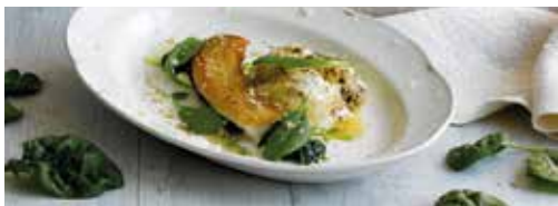
ボン・ヴィヴァント デッキ7 高級レストラン コモドアクラス専用のご朝食をご用意しております。