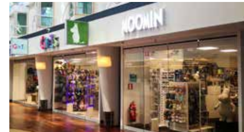
公式ムーミンショップ 幅広いムーミングッズの取り扱い