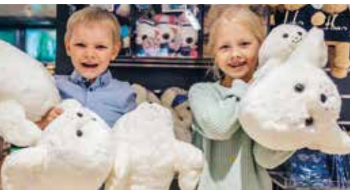
キッズ & トイ おもちゃ、子供服、ムーミングッズ