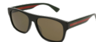
GUCCI サングラス 289,00 €