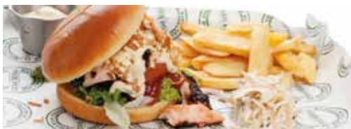
ファスト・レーン デッキ7 サラダ、サンドイッチ、ファーストフード、 ドリンク