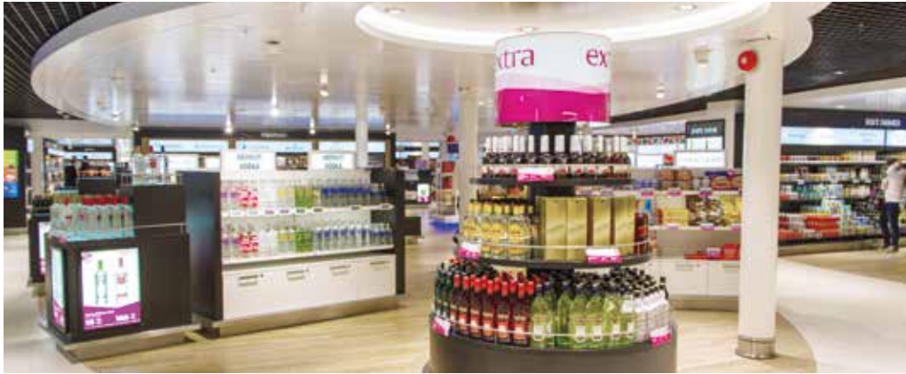
タックスフリー・スーパーストア 化粧品・香水、飲料品、お菓子、アクセサリ、健康食品

各ショップはクルーズ中営業しています。 正確な営業時間は各店舗の入り口をご覧ください。