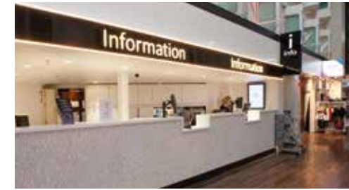
インフォメーションデスク 船内プログラムから旅先の情報まで、お困りごとは24時間対応のインフォメーションデスクにお尋ねください。