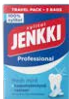
JENKKI キシリトール フレッシュミント 3パック 270g 9,00 €