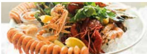
ハッピー・ロブスタ デッキ7 魚とシーフードのレストラン。おすすめは 美味しいシーフードの盛り合わせ。 予約不可