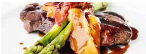
グリル・ハウス デッキ7 ジューシーなステーキを提供する グリルレストラン。 予約不可