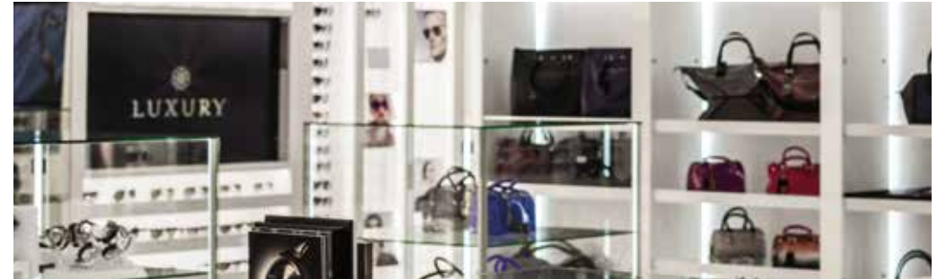
ラグジュアリー ジュエリー、ハンドバッグ、その他高級アクセサリ