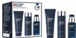
BIOTHERM HOMME フェイシャルトリートメント 125+200+50ml 129,00 €