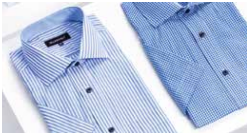
ファッション 男性・女性向けの洋服、アクセサリ