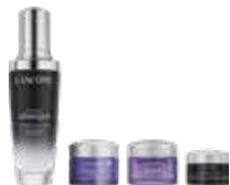
LANCÔME ジェニフィック セラムセット 50+5+15+15 ml 115,00 €