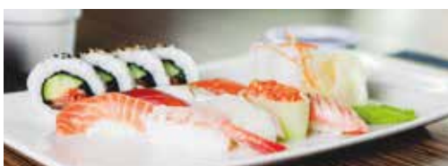
Sushi & Co. デッキ7 寿司、サラダ、デザート類