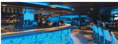
バー デッキ7, 8に各種バーやバブ、デッキ13にはクラブがございます。 カクテルやその他のドリンクをお楽しみください。