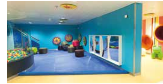
シリランド・キッズプレイルーム ゲーム、お絵かき道具、ボールプール、アイスクリームバーなど、お子様が大好きな遊び場が盛り沢山。