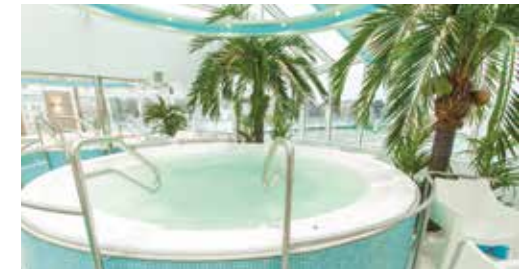
サウナ&スパ サンフラワー・オアシス サウナとジャグジー完備のリラクゼーション施設