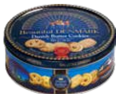
JACOBSENS BAKERY バタークッキー (デンマーク製) 454g 7,90 €