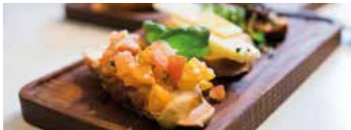
タボラタ・レストラン・イタリアーノ デッキ6 イタリアン・アラカルト・レストラン。 朝はスペシャルブレイクファストをご提供しております。