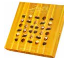
LINDT ミニブラリネ ゴールド 155g 14,90 €