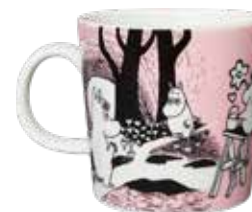
MOOMIN BY ARABIA マグカップ・ラブ、ピンク 0,3l 20,50 €