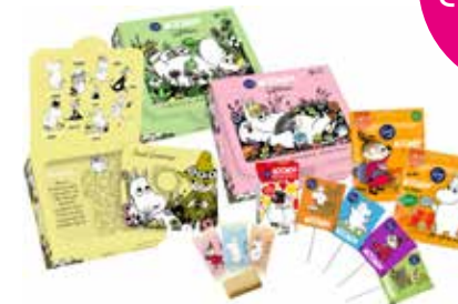
FAZER ムーミンギフトボックス 252g 11,80 €