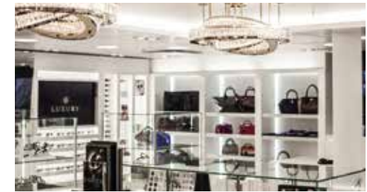
ラグジュアリー ジュエリー、ハンドバッグ、その他高級アクセサリ