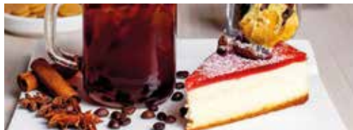
コーヒー& CO. デッキ7 コーヒー、紅茶、ドリンク、ペストリー、ケーキ