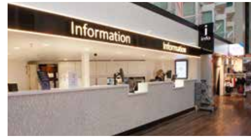
インフォメーションデスク 船内プログラムから旅先の情報まで、お困りごとは24時間対応のインフォメーションデスクにお尋ねください。