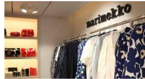
マリメッコ公式店舗 フィンランドのデザインショップ。衣類・アクセサリ・バッグ小物など