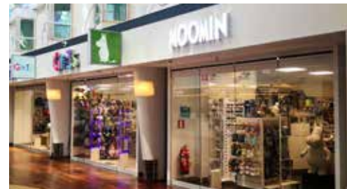
公式ムーミンショップ 幅広いムーミングッズの取り扱い