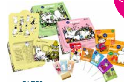
FAZER ムーミンギフトボックス 252g 11,80 €