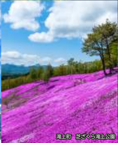
滝上町 芝ざくら滝上公園