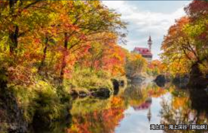
滝上町 滝上溪谷「錦仙峡」