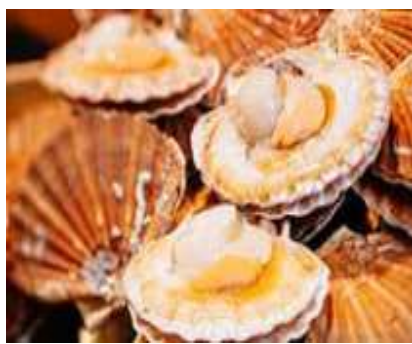
紋別/湧別・ほたて