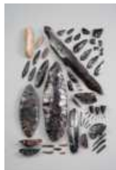
遠軽・白滝 国宝黒曜石