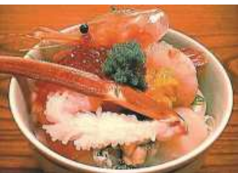
紋別・海明け毛ガニ