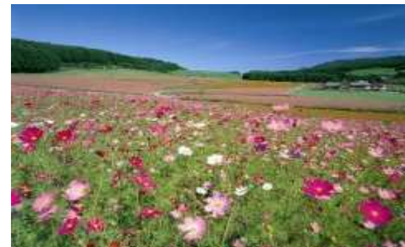
遠軽・コスモス園