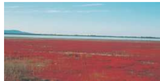
紋別／湧別・サンゴ草