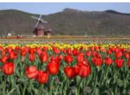
湧別・チューリップ