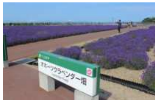
紋別・海とラベンダー