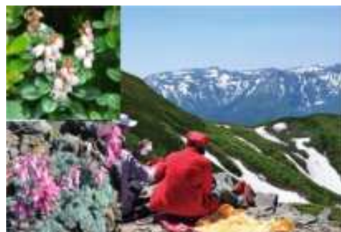
白滝・高山植物群