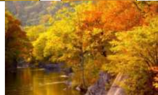
滝上・錦仙峡紅葉