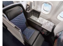
プライバシーを確保した個室タイプのビジネスクラス「デルタ・ワンスイート」

POINT 03 ニーズに合わせた4つの座席クラス 個室タイプのビジネスクラスやプレミアムエコノミーなど