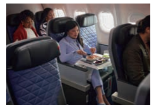
上質な空間とサービスで快適な旅を約束する

シートピッチ最大38インチ(約96.5cm)の広いスペースに深いリクライニング、可動式レッグレストとフットレストを備えた快適なシート。またチェックインや搭乗、保安検査場(一部空港)、手荷物取り扱いなど、「スカイプライオリティ」の各種優先サービスを受けることができる。アメニティキットやノイズキャンセリングヘッドセットも提供。機内食の事前予約サービスもスタートした。