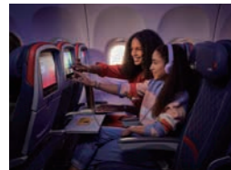
広めのレッグルームと優先サービスでワンランク上の快適さを提供する「デルタ・コンフォートプラス」