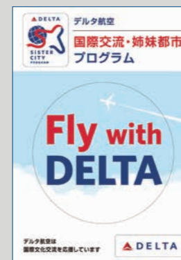
バゲージタグとステッカー

6名以上の団体を対象に、まとまったエリアの座席指定(空き状況による、一部制限あり)やオリジナルグッズのプレゼントなど、デルタ航空だけの特典を提供。学生団体向けには、同様の「学生団体プログラム」も用意している。詳しい内容や申し込みについては旅行会社まで。