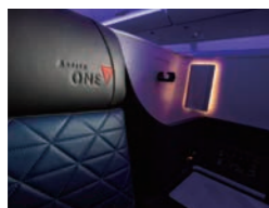
フルフラットシートを備えたビジネスクラス「デルタ・ワン」

POINT 03 ニーズに合わせた4つの座席クラス 快適なフライトを提供する人気のプレミアムエコノミーも