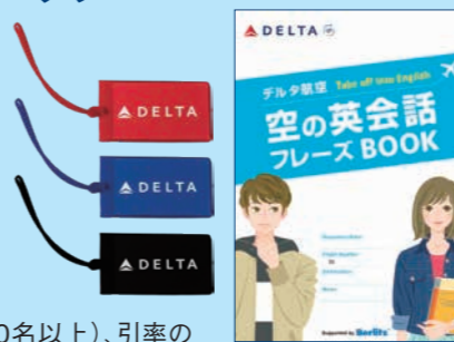
パッケージとベルリッツ・デルタ航空共同監修のオリジナル英会話ブックを提供

10名以上の団体を対象に、まとまったエリアの座席指定(空き状況により、一部制限あり)や、学校名を入れたウェルカムアナウンス(30名以上)、引率の先生1名無料(30名以上)、オリジナルグッズのプレゼントなどの特典を提供。国際交流団体向けには、同様の「国際交流・姉妹都市プログラム」も用意している。詳しい内容や申し込みについては旅行会社まで。