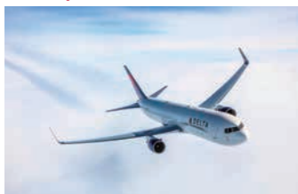
羽田-ホノルル線の使用機材

デルタ航空の羽田-ホノルル線は、毎日の運航。都心からアクセスしやすい羽田空港発着なのが便利。また羽田を夜に出発するので、仕事終わりでも利用できるほか、現地ホノルルには翌日の午前中に到着するので、到着日を有効活用できる。戻りのホノルル発も午後なので、ゆっくりとランチを楽しみながら出発できる。