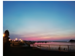
◀晴れた日の夕暮れ時は息をのむような美しさに

海に浮かぶ「大黒島」を目の前に快適な車中泊を楽しめる、キャンピングカーユーザーにおすすめのスポット。全サイトオーシャンビューで、水道&電気を使えるサイトも。各サイト内ではテント&タープ設営やBBQもOK!