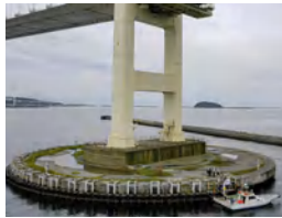
◀海に浮かぶ橋脚から主塔内部のエレベーターへ!

全長 1380m の白鳥大橋をがっしり支える人工島から、作業用エレベーターで一気に空中 100m の世界へ! 鳥の目線で眺める絶景を楽しもう! クルーズは多彩なラインナップがあるので、詳しくは公式サイトをチェック。