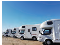
◀サイトは7m x 7m、電源の有無で料金変動