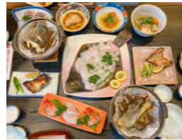
◀とれたての新鮮な魚を料理人が絶品料理で提供

天然の良港・室蘭港には、実はソイやアイナメ・カレイなどの大物がいっぱい! チャーター船に乗り込んで、ガイドと一緒に手ぶらで釣りを楽しんだ後は、温泉と海鮮グルメでおなかも心も大満足♪