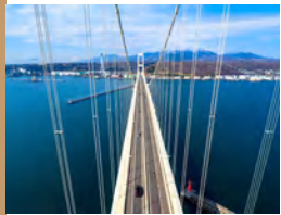
◀巨大な吊り橋に登る全体的にも珍しい感動体験