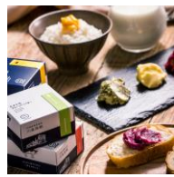
商品例・とよみフレーバーバター

北海道豊富町は酪農の町。セイコーマートブランドとして有名な豊富町の生乳は、その高い品質と味わいから北海道ではとても有名です。その豊富牛乳を使用したバターやプリン、ゼラートやスコーンなど様々な商品をご用意しております。