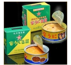
商品例・宝うに缶詰

北海道最北の離島である礼文島で水揚げされた、うに、昆布、ほっけ、たら、鮭、アワビ、タコ、カニ、エビなどを産地直送でお届けいたします。