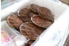
商品例 猿払村の活ほたて

全国でも有数のほたての名産地。厳しい天然の環境で稚貝を撒き、低い水温の地域で育ったほたては甘みと旨みが強く4年をかけて育てられます。その間、順調に成長したほたての海の幸をご賞味ください。