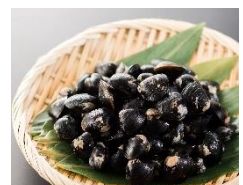
商品例・天塩のしじみ

天塩の自然が育んだ上品な風味と大粒で濃厚な味は絶品です。天塩町の特産品「しじみ」をとくとご堪能あれ!