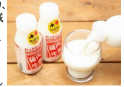
商品例・稚内牛乳

「日本のでっぺん」稚内の豊かな自然で生まれた、農畜産物や水産物、生産される産品や地域資源を「稚内ブランド」として認定し、広く発信することで知名度向上を図っています。ぜひ、稚内自慢の味をお楽しみください。