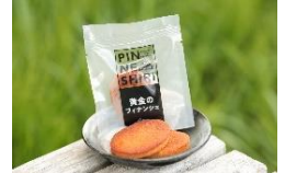
商品例・黄金のフィナンシェ

北海道の北、枝幸郡中頓別町。中頓別町を見守る、多様な植物や動物の生息地『敏音知岳』。道の駅売店や近隣ショップでしか出会えない果実の大自然が生んだ食品やお土産をお楽しみください。