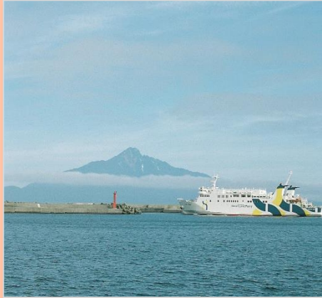
Instagramフォトコンテスト「#私が見つけた宗谷」入賞作品

「宗谷エリア」の 各市町村には、 自慢の逸品がたくさん！ ネットでも買える逸品を ご紹介します。