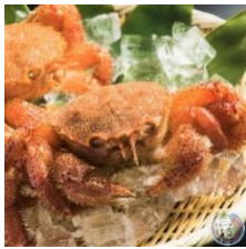
商品例 枝幸産毛ガニ

北海道枝幸町(えさしちょう)が誇る自慢の海産物や山の幸、銘菓などを取り扱う枝幸町特産品ショップです。