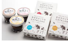
商品例・放牧牛のアイスクリームとカタラーナ

放牧牛の優しい甘みを感じられ、すっきりとした後味のアイスクリーム。優しく混ぜるとゼラートのような触感がオススメです。牛乳の風味がたっぷりと味わえるカタラーナは、柔らかくなってから、一口サイズでお召上がりください。