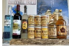
商品例 幌延町産ミスナラ樽を使い熟成させたお酒達

ホロカルでは北海道幌延町の特産品を購入することができます。幌延町産のミスナラ樽を使用し、熟成させたお酒を始めとして、トナカイの角細工やミツロウワックス、洗顔料など、幌延町にしかない商品を楽しんでください!