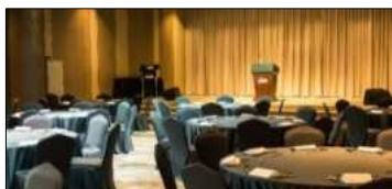
グランドボールルーム 250席