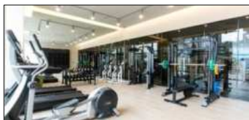
フィットネスセンター 06:00 - 22:00