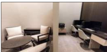
ビジネスセンター 06:00 - 22:00