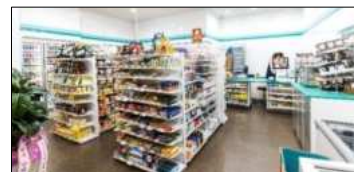
コンビニエンスストア 24時間運営 (深夜セルフ決済)