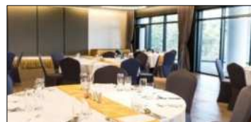
Banquet Blue 150席