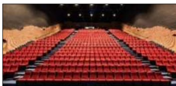
カンファレンスルーム(ナント劇場) 659席