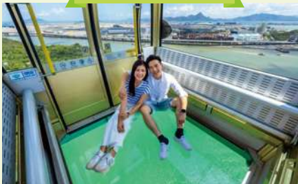
透明なガラス床の車内デザイン