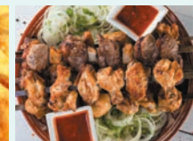
シャシリク(肉の串焼き)