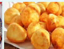
ボールソック(揚げパン)