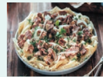
ベシバルマック(伝統料理)