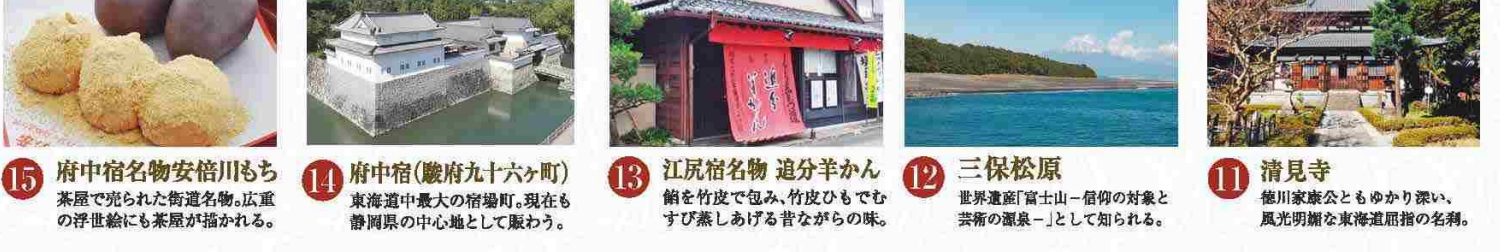
8 間の宿西倉沢 富士山の眺めが素晴らしい場所で、立ち寄る人も多く、茶屋が繁盛した。 11 清見寺 徳川家康公ともゆかり深い。風光明媚な東海道屈指の名刹。 13 江尻宿名物 追分羊かん 餅を竹皮で包み、竹皮ひもでもむすび蒸しあげる昔ながらの味。 12 三保松原 世界遺産「富士山-信仰の対象と芸術の源泉-」として知られる。