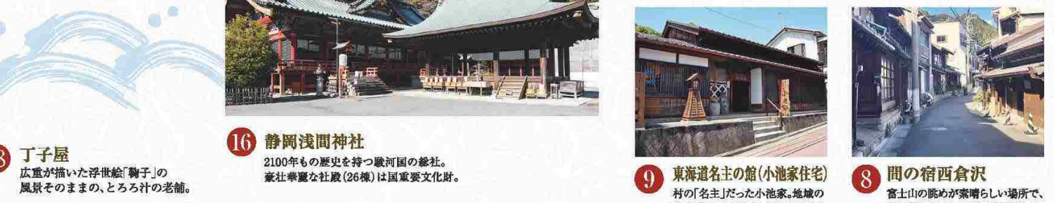
7 由比宿名物たまご餅 由比川のほとりで売られていた街道名物。当時はさとうと呼ばれていた。 16 静岡浅間神社 2100年もの歴史を持つ駿河国の総社。豪壮華麗な本殿(26棟)は国重要文化財。 9 東海道名主の館(小池家住宅) 村の「名主」だった小池家。地域の有力者らしい重厚な佇まいである。