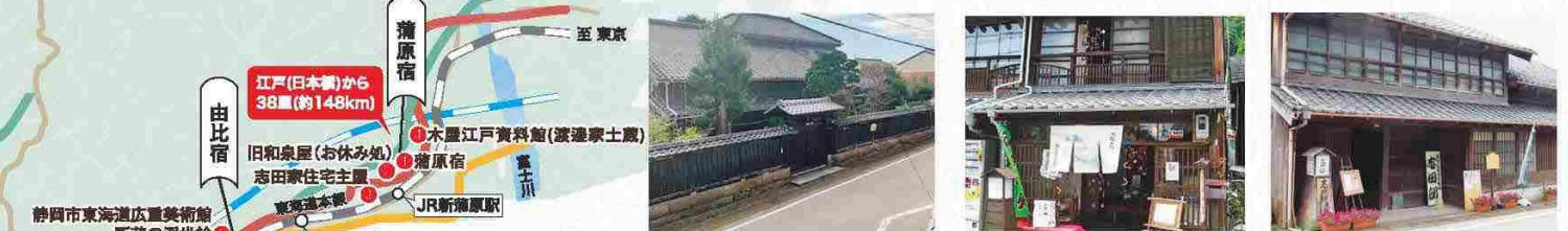
1 蒲原宿 江戸品川宿から15番目の宿。富士川を越えて一息つく宿場。 2 旧和泉屋(お休み処) お休み処として訪ねることができ、旅籠の面影を感じることができる。 3 志田家住宅主屋 典型的な町屋の造り。建物や道具類が江戸の暮らしを伝える。