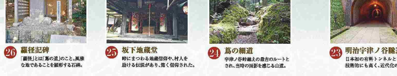
26 羅徑記碑 「羅徑」とは「馬の道」のこと。風雅な地であることを顕彰する石碑。 25 坂下地藏堂 時につわる地藏信仰や、村人を助ける伝説があり、篤く信仰された。 24 萬の細道 宇津ノ谷峠越えの最古のルートとされ、当時の面影を感じる山道。 23 明治宇津ノ谷隧道 日本初の有料トンネルといわれ、技術的にも高く、近代化の象徴。