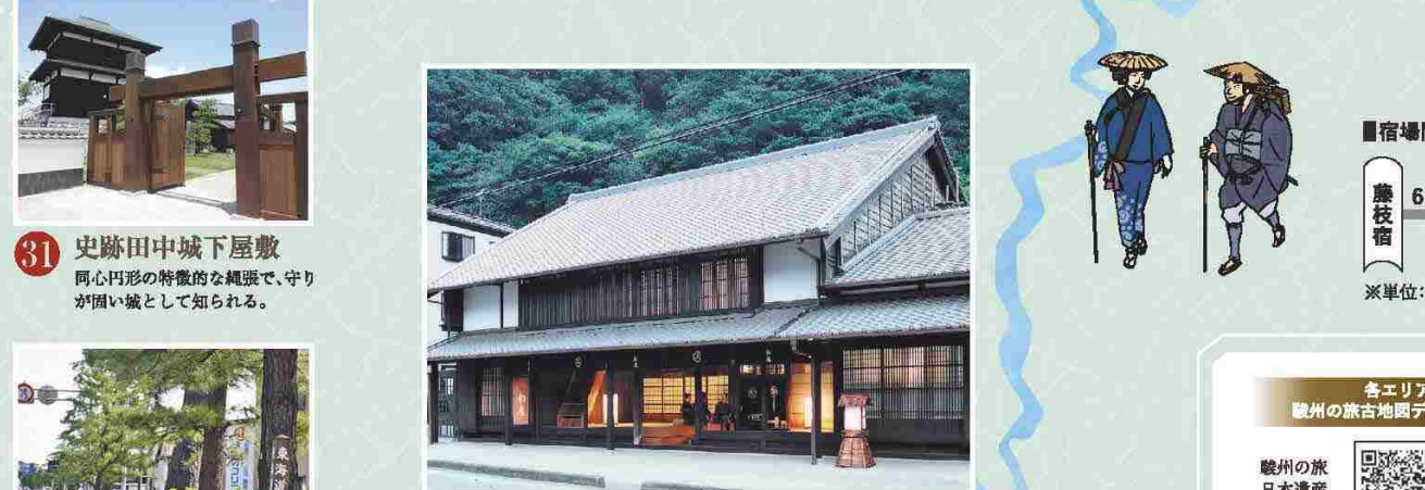
31 史跡田中城下屋敷 同心円形の特長的な縄張で、守りが固い城として知られる。 28 岡部宿大旅籠柏屋 天保7年(1836)の建物で、江戸時代の旅の様子や庶民の暮らしを学ぶことができる。