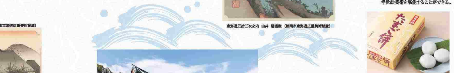
10 薩埵峠 峠越えの道は危険な断崖絶壁。「親知らず子知らずの懸所」といわれた。 6 静岡市東海道広重美術館 広重の名作など約1400点を収蔵。浮世絵芸術を堪能することができる。