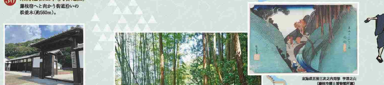
30 東海道松並木(内谷地区) 藤枝宿へと向かう街道沿いの松並木(約560m)。 29 岡部宿本陣址 岡部宿の本陣跡地。現在は門などが再現され、史跡広場となっている。