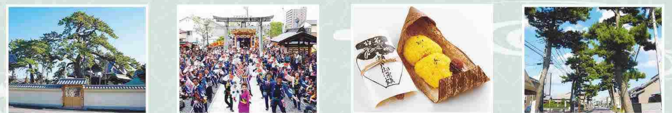
32 大慶寺 久遠の松 日蓮上人お手植えの「久遠の松」は樹齢750年と推定される巨木。 33 鮎波神社大祭の奉納踊り 江戸風の粋な風情のなごりを伝え、地域を挙げての賑わいとなる。 34 瀬戸の染飯 蒸した糯米を麴で黄色く染めて干したものを。旅人に評判だった。 35 東海道松並木(上青島地区) 江戸時代以降も、松を植えて街道の景観を守り伝えている。