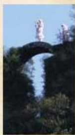
峯入りと無明橋(奥岩屋)

鬼会面の表情はバリエーションに富み、すごんだ顔だけではない。鬼会面をじっと見つめていると、時には笑顔で、時には自慢げに、もしかしたら鬼のくせして目に涙を滲ませながら、里の昔話を聞かせてくれるかもしれない。