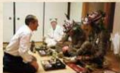
馴染みの鬼と酒を交わす(岩戸寺)

岩戸寺・成仏寺では、講堂での所作が終わると、鬼達は集落へと繰り出す。人々はこぞって鬼を自宅に招いてもてなし、鬼と酒を酌み交わす。「知らぬ仏より、馴染みの鬼」とはよく言ったもので、人々は年に1度の鬼と語るこの夜をこの上なく心待ちにしている。