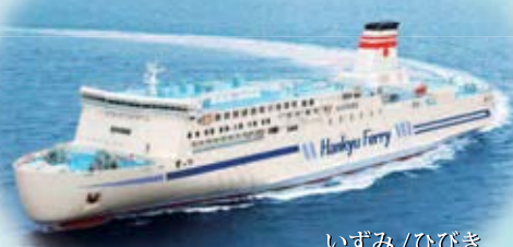
いずみ / ひびき せつつ / やまと