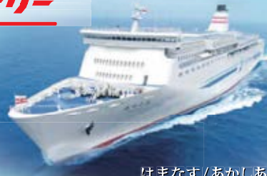
はまなす / あかしあ