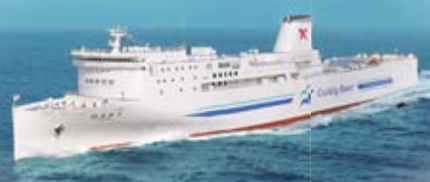
はまゆう / それいゆ