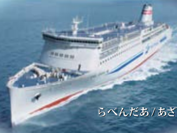
らべんだあ / あざれあ