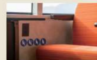
バリアフリー座席