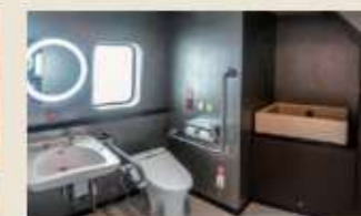
バリアフリートイレ