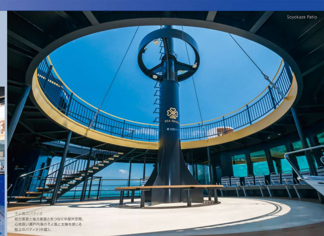
そよ風のパティオ ▶ 前方客室と後方客室とをつなぐ半屋外空間。心地良い瀬戸内海のそよ風と太陽を感じる船上のパティオ(中庭)。