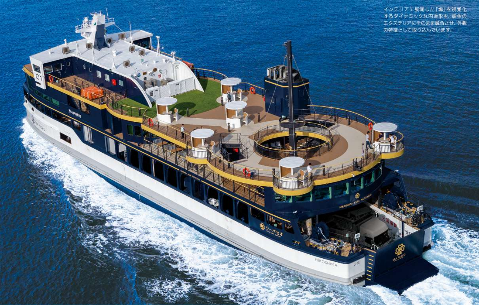
インテリアに展開した「船」を視覚化するダイナミックな内装形態。船体のエクステリアにその味を融合させ、船観の特長として取り込んでいます。