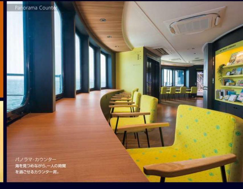
パナレラ、カウンター ▶ 海を眺めながら一人の時間を過ごせるカウンター席。