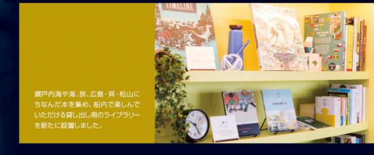
瀬戸内海や海、京、広島・岡山にちなんでお土産、船内で楽しんでいただけるオリジナルのグッズや、船内に必要なあらゆるサービスを新たに設置しました。