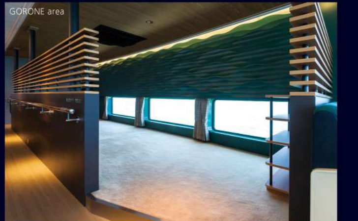
GORONE (ごらわ) エリア ▶ フェリーならではの離陸時、波に揺られる感覚を肌で感じるできる寛スペース。こちら望しながら海が見える小窓がついています。