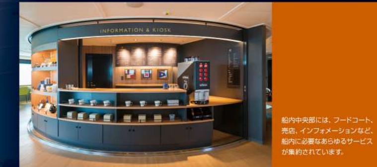
船内中央部には、フードコート、売店、インフォメーションなど、船内に必要なあらゆるサービスが集約されています。

少人数から大人数まで、グループで活用できる飲食コーナーとして、リフレッシュ・ラウンジや、靴を脱いでくつろげる小上がり席を設けています。また、お一人での飲食スペースとして利用頂ける、充電、PC利用も可能な、海に臨むカウンター席も用意しています。