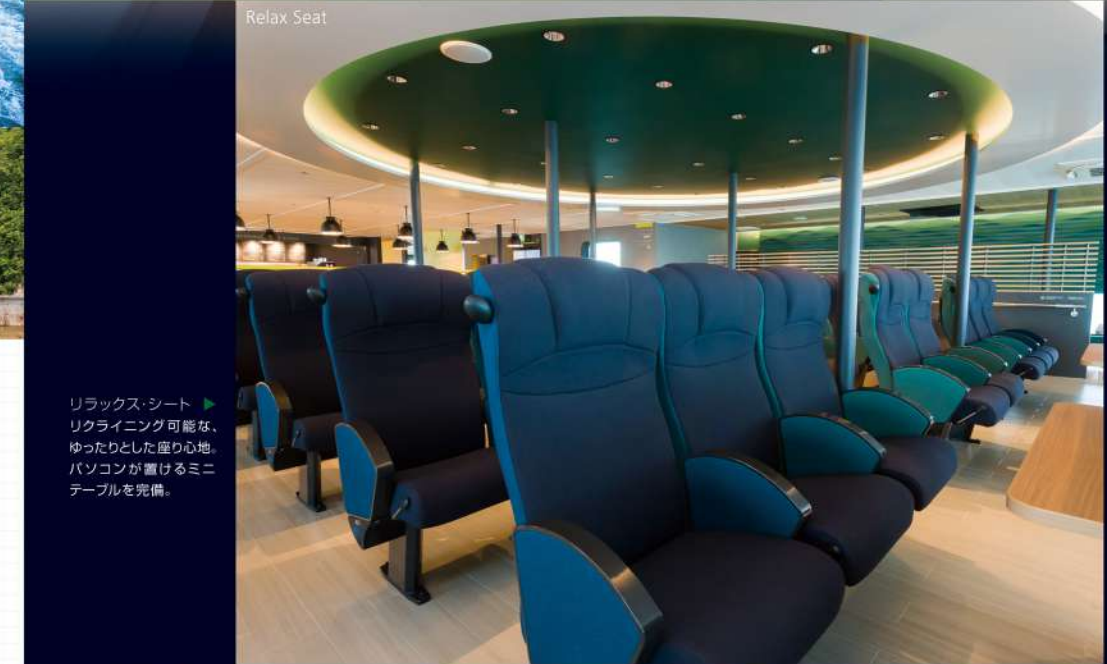
リラックスシート ▶ リクライニング可能な、ゆったりとした座り心地。パソコンが置けるミニテーブルを完備。