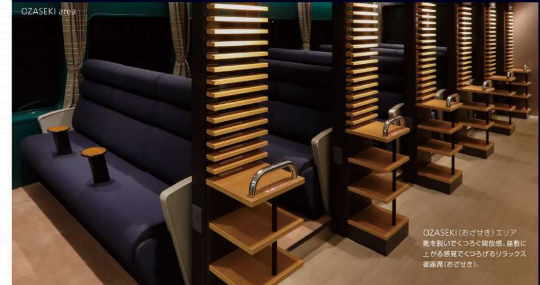
OZASEKI (おざせき) エリア ▶ 靴を脱いでくつろぐ開放感。階段に揺られる感覚に上がる感覚でくつろげるリラックス座席(おざせき)。