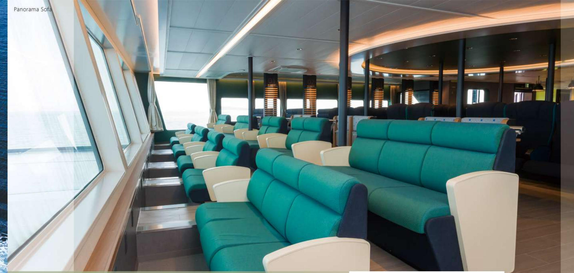
静かにゆったりと過ごす「快適」のゾーン