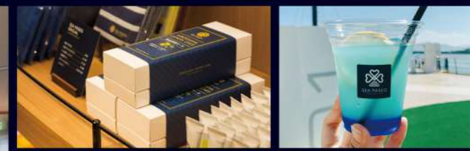
瀬戸内海や広島、岡山、松山にちなんだオリジナル飲食メニューのほか、シーバオオリジナルの商品販売を行っています。