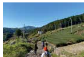
協力してチェックポイントを巡ります