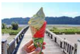
蓬萊橋 897.4 茶屋でスイーツ

島田市内から粟ヶ岳までの道のりを歩きながら、旧東海道の宿場町やお茶の歴史を学べます。