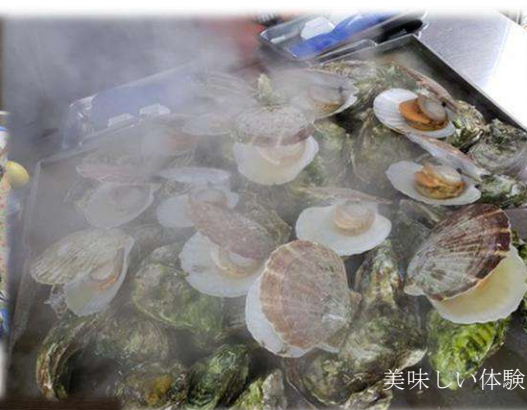
美味しい体験＋本物体験