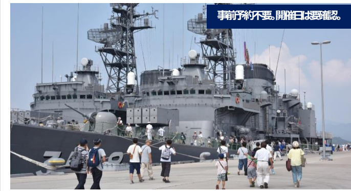
事前予約不要、開催日は要確認。

海上自衛隊呉地方隊では、創設70周年を記念して、毎週土曜日・日曜日に第1庁舎ならびに艦艇を一般公開しています。