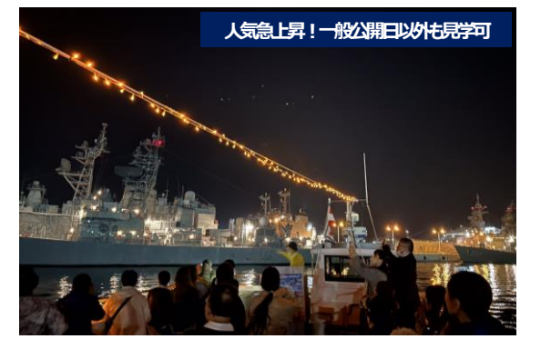
人気急上昇！一般公開日以外も見学可

艦艇一般公開(見学所要時間約60分) 第1回 13:15 受付開始(見学時間13:30~14:30) 第2回 14:45 受付開始(見学時間15:00~16:00)