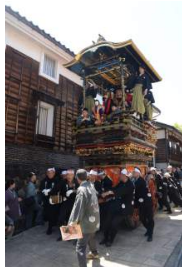
— ユネスコ無形文化遺産 — 城端曳山祭