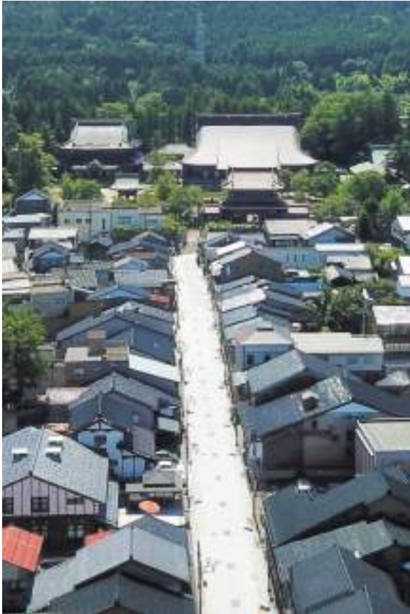
— 日本遺産 — 井波