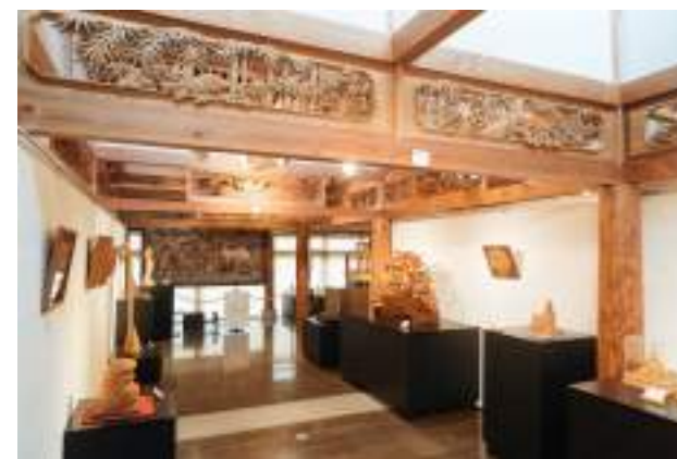
井波彫刻総合会館