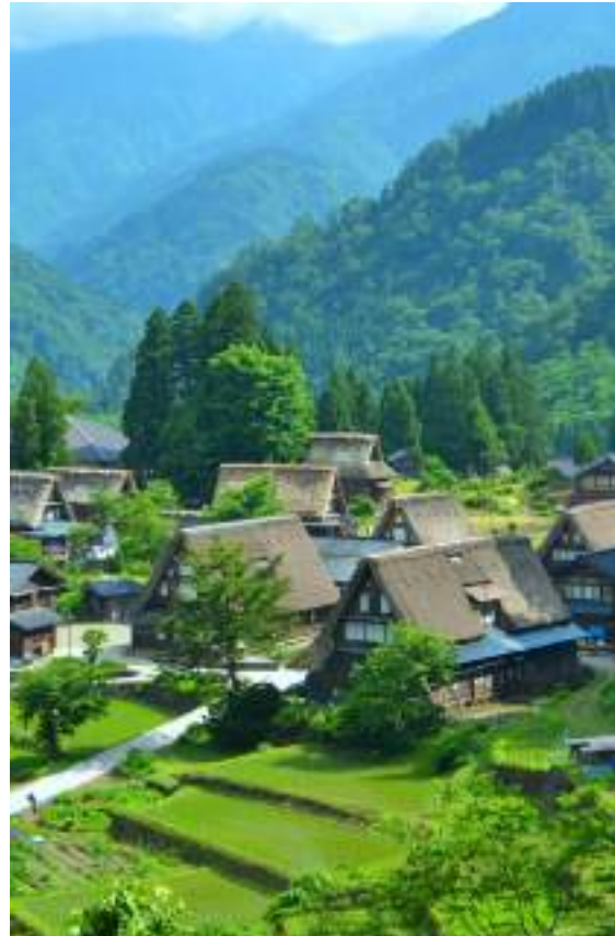
— 世界遺産 — 五箇山合掌造り集落