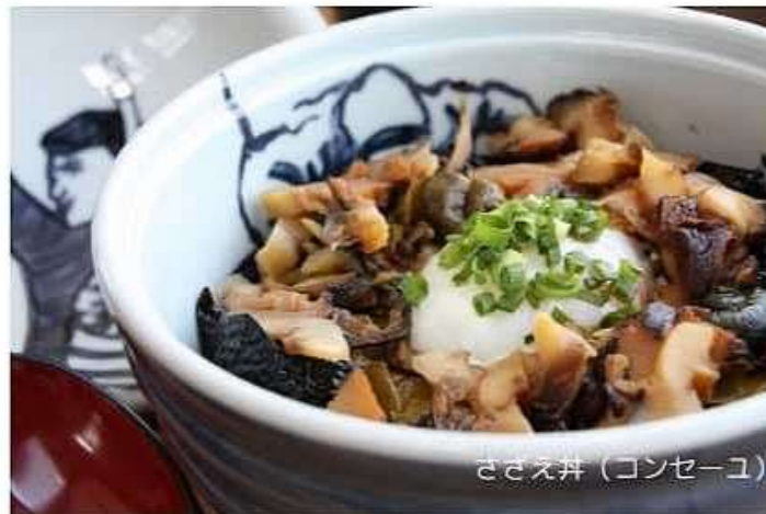
さざえ丼 (コンセーユ)