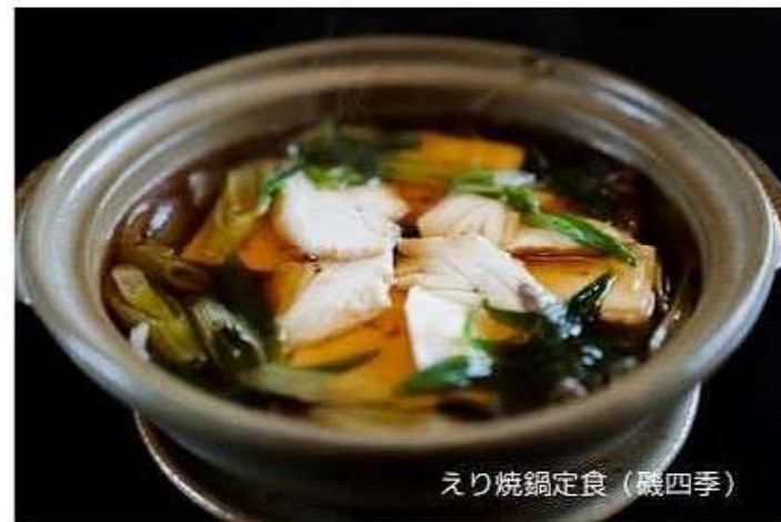
えり焼鍋定食 (嶽四季)