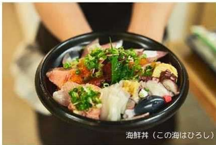
海鮮丼 (この海はひろし)