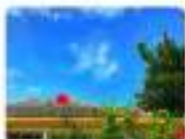
真比奈にハイビスカス (伊勢 直)