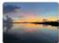
一期一会に彩られる真珠湾の 朝と海 (平谷直樹)