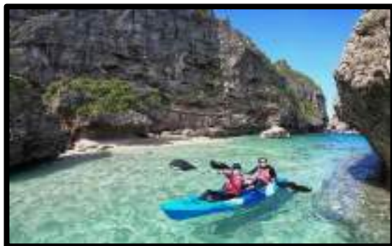
シーカヤック・SUP体験