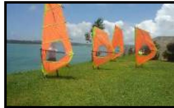
ウインド&ウイングサーフィン