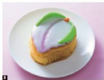
从船上及离台等地均可欣赏到价值千万美元的夜景。白天天气晴好时还能眺望“军舰岛”。当地特产——好适甜点“橘子长崎蛋糕”也绝对不容错过。