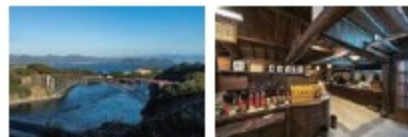
日本国家重要文化渔场“西海”同种附近浦头地区，于1767年创桥，可说是世界著名胜业约“海桥看海”。