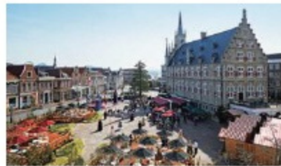
日本最大规模主题乐园“豪斯登堡”。