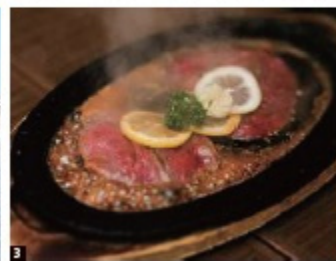
得到全球最美海湾认证的“九十九岛”。毗邻佐世保站与中心街区的“佐世保港国际码头”（三浦岸壁）。人气不亚于佐世保汉堡的当地美食“柠檬牛排”。