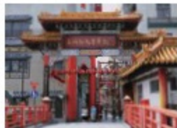
中华料理店、中国糕点、杂货店等的40家店铺鳞次栉比的“新天地中华街”。

离港前，不妨站在市内高台或船只的甲板上，将堪称“世界新三大夜景”的长崎夜景尽收眼底，为本次充实的长崎之行画上一个圆满的句号。