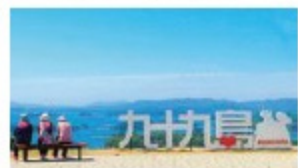
2021年3月开业的“九十九岛观光公园”，尽享绝景风光。

在靠近豪斯登堡的浦头地区打造了全新码头，不妨期待一场客轮在环游东亚后于佐世保靠岸停留的惬意旅行吧。