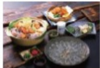
同时，长崎县也是日本全国一流的烧肉原产地。