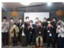
▲移住後の新たな女人間関係

実は、地元であっても40年間離れば「よそ者」と一緒。自分から現地のコミュニティに入って関係を積極的に作る事が大切。現在は地元の神社の会報を作成したり、Cafeの新メニュー開発のために人と人とをマッチングしたり…充実した日々です。