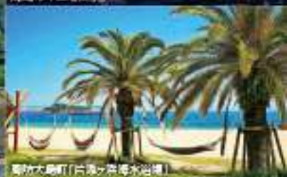
鹿角市「白旗ヶ浜海水浴場」

名勝・錦帯橋を有する岩国市や“瀬戸内のハワイ”と呼ばれる周防大島、工場夜景の美しさで知られる周南市など、10の市町がある山口県東部。瀬戸内海に面した地域は気候も温暖で、中でも柳井市は年間日照時間が全国トップクラスを誇ります。美しい海も見どころで、光市の虹ヶ浜海水浴場をはじめ「快水浴場百選」に選ばれた海水浴場も。美しい自然に恵まれた、ゆったりと過ごせるエリアです。