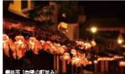
柳井市「白壁の町並み」