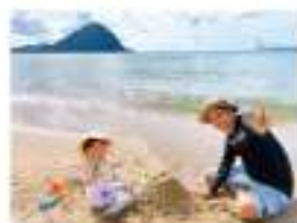
▲萩の海でレジャー、海も身近です。