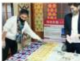
▲現地和紙の体験を通して魅力に触れる