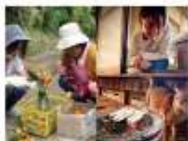
▲田舎暮らしならではの一幕

地域の方のほとんどは野菜などを育てていて、有難いことにお裾分けをいただきます。また、季節ごとの山の幸、海の幸…それらを「食べる?」と人の温かさが加わり私たちの元へ。ギブ&テイクでもなく、さまざまなギブがまわっているような新しい感覚がここにはありました。