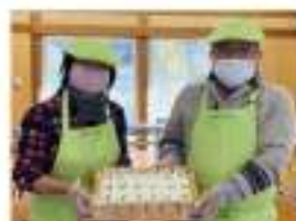
▲宇部吉岡地区でのゆづりいし寿司の体験