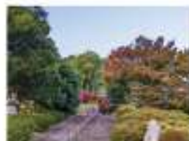
▲休日には公園でランニングも