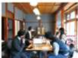
▲現地の事業者とミーティング

新しい地域で事業者の方とお話すると、きっと役に立てることがあると思っ話を行います。例えば俵山では…クラフトビールの話が出て、これまでの商品開発の実践例を基にビジネスモデルの構築を伝えました。せっかく来訪するのであれば、現地の方と関わるのがオススメです。