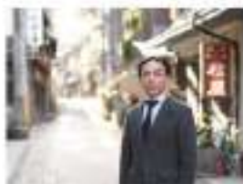
▲俵山温泉に宿泊し、土地の魅力を体験