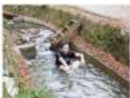
▲初体験！川の水風呂を利用したサウナ

ワーケーションというものはリラックスするという目的の他に、これまでの固定概念から離れ、予定調和でない革新的で新しい発想に出会う機会だと思っています。今回の体験でも、多くの方に出会い、感覚が研ぎ澄まされるような時間が過ごせました。