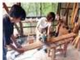
▲丸ノコでテーブル作り挑戦