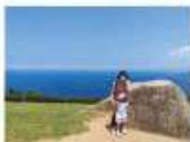
▲移住後長門市の千畳敷へ

移住前はテレワークで仕事に支障が出ないかが気かりでしたが、コロナ禍でテレワーク中心になっていたことと、会社の理解もあり、問題なく進められています。平日は山口県庁1Fのテレワークオフィスで仕事をして、2ヶ月に1回ほど東京の会社に出勤しています。