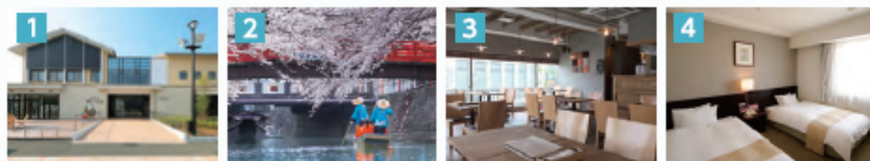
1 奥の細道むすびの地記念館 2 水の都おおがき舟下り・たらい舟 3 指定飲食店 4 指定宿泊施設