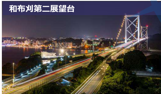
和布刈第二展望台

運行：4月～9月：19時頃出発 10月～3月：18時30分頃出発 小倉港出発：第1・2・3・5土・日曜日 門司港出発：第4土・日曜日 料金：大人2,500円、小学生1,250円