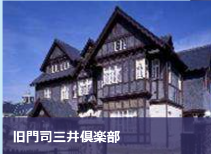
旧門司三井倶楽部