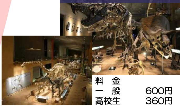
いのちのたび博物館