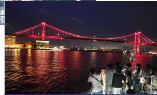
若戸大橋 (工場夜景クルーズより)

運行：4月～9月：19時頃出発 10月～3月：18時30分頃出発 小倉港出発：第1・2・3・5土・日曜日 門司港出発：第4土・日曜日 料金：大人2,500円、小学生1,250円