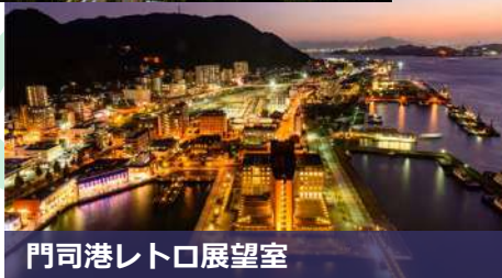
門司港レトロ展望室