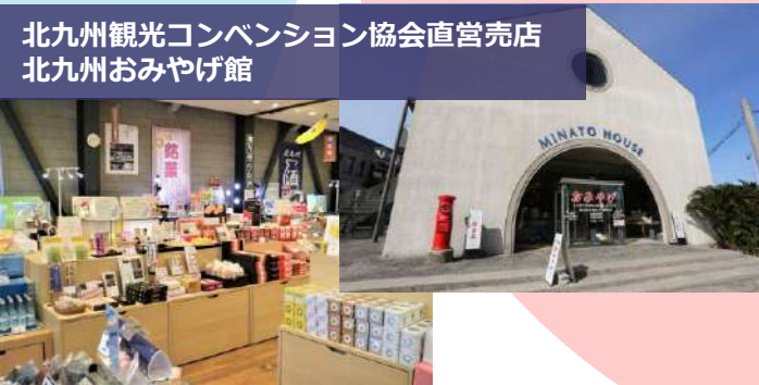
北九州観光コンベンション協会直営売店 北九州おみやげ館

北九州名物を使用した商品や、ネジチョコをはじめとした、銘菓や辛子明太子、地酒や工芸品などバラエティに富んだ充実の品揃え。