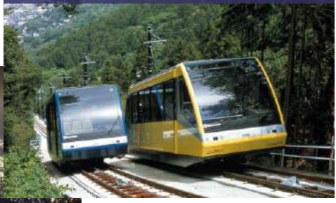
皿倉山ケーブルカー