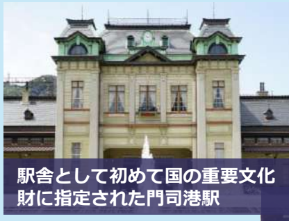
駅舎として初めて国の重要文化財に指定された門司港駅