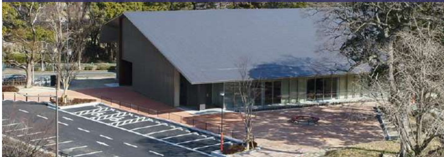
北九州市平和のまちミュージアム