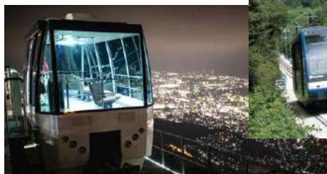
皿倉山スロープカー

料金：ケーブルカーとスロープカー往復通し券 大人1,230円 小学生以下620円