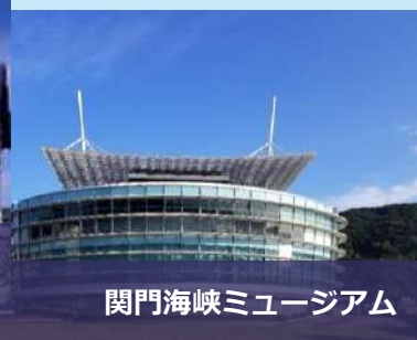
関門海峡ミュージアム