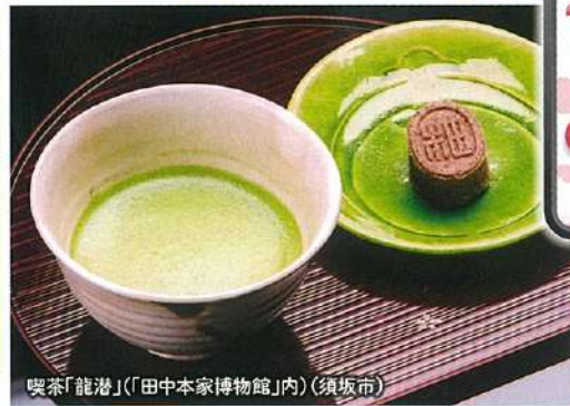
喫茶「龍潭」(「田中本家博物館」内)(須坂市)