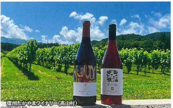
信州たかやまワイナリー(高山村)