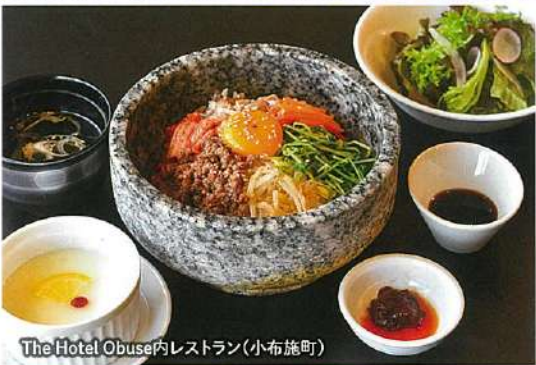
The Hotel Obuser内レストラン(小布施町)