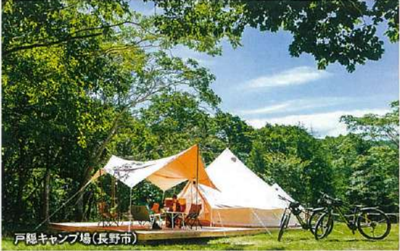
戸隠キャンプ場(長野市)