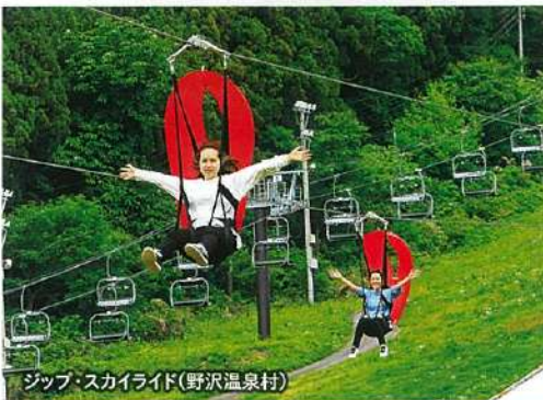
ジップ・スカイライド(野沢温泉村)