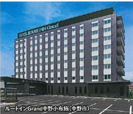
ルートインGrand中野小布施(中野市)