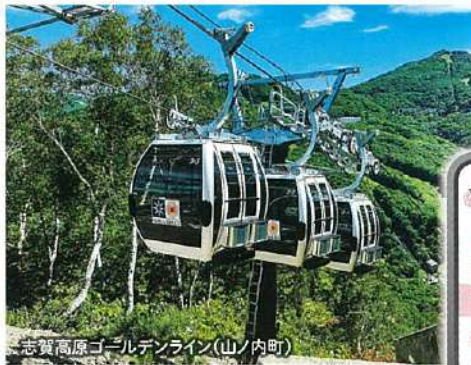
志賀高原ゴールデンライン(山ノ内町)