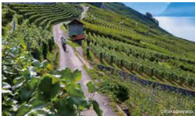
世界遺産ラヴォー地区をEバイクとワインテイスティング

氷河を頂く4,000m級のアルプスが織りなす山岳風景をはじめ、牛達が放たれた緑の牧草地、広大なレマン湖畔のリゾート地や斜面に広がるぶどう畑、ローヌ河沿いの自転車専用道、都市の旧市街や観光スポットを巡るシティライドまであらゆるサイクリストの夢を叶えてくれます。スイスは鉄道、バス、湖船をはじめ公共トラベシステムが世界一進んでいるのが魅力。パッケージプラン以外にオーダーメイドプランで広範囲に効率的な良いロングライドツアーが可能です。