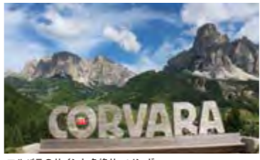
コルバラのサインと名峰サッソングー