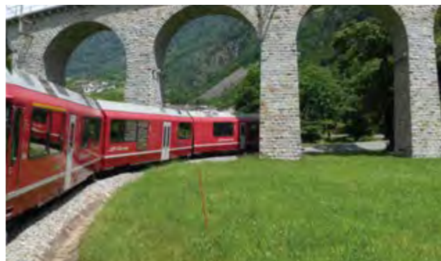
ベルニナ特急沿線をライド&トレイン

募集人員:8名限定、最少催行人員:6名 利用予定航空会社:ルフトハンザドイツ航空、スイスインターナショナルエアラインズ、エールフランス、オーストリア航空、ターキッシュエアラインズ、フィンランド航空 食事:(8日間コース)朝6回、昼0回、夕5回、(12日間コース)朝8回、昼0回、夕6回、(12日間コース)朝10回、昼0回、夕6回 利用予定ホテル:イビスバジェットチューリッヒ・シティヴェスト、ザ・フラッグチューリッヒ、プリストル・チューリッヒ(チューリッヒ) ユーロテルモントルー、ロイヤルプラザモントルー(モントルー) ヴィラルールロッジ、アルバインクラシックホテル、ホテル・デュ・ヴィラルール(ヴィラルール) ホテルフルカ、フーベルトゥス(オベルワルド) ラティオンブルー・アンデルマツト、ツム・シュワルゼン・パレン(アンデルマツト)、ノボテルバーゼル、イビスバジェットイビスバジェットバーゼル、ホリデーインエクスプレス(バーゼル) *10日間スペシャルコースは、チューリッヒ空港到着後は、ダイレクトにモントルーへ移動し2日目からスタートします。ツアー後半は、バーゼルが1泊減って2泊となります。 *旅行代金は2人部屋を2名様で利用する場合の1名様の料金です。*お一人様でお部屋をご利用になる場合は、追加料金が¥78,000(8日間)、¥104,000(10日間)、¥130,000(12日間) 別途掛かります。 *上記日程に記載したコースは予定コースです。天候、お客様の体調、道路交通事情によってサイクリング日程が変更となる場合があります。*80km以上の走行時はサポートカーが帯同致します。*国内線料金:各空港から国際線出発空港まで片道1.5万円より。(ご希望の方はお問い合わせください) *成田発着が羽田発着になる場合があります。 サイクリングの合間にハイキングや氷河スキーも楽しむことができます。