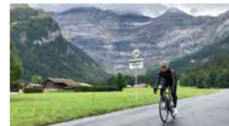
スイス・クラシックパス巡りライド

募集人員:8名限定、最少催行人員:6名 利用予定航空会社:ルフトハンザドイツ航空、スイスインターナショナルエアラインズ、エールフランス、オーストリア航空、ターキッシュエアラインズ、フィンランド航空 食事:(8日間コース)朝6回、昼0回、夕5回、(12日間コース)朝8回、昼0回、夕6回、(12日間コース)朝10回、昼0回、夕6回 利用予定ホテル:イビスバジェットチューリッヒ・シティヴェスト、ザ・フラッグチューリッヒ、プリストル・チューリッヒ(チューリッヒ) ユーロテルモントルー、ロイヤルプラザモントルー(モントルー) ヴィラルールロッジ、アルバインクラシックホテル、ホテル・デュ・ヴィラルール(ヴィラルール) ホテルフルカ、フーベルトゥス(オベルワルド) ラティオンブルー・アンデルマツト、ツム・シュワルゼン・パレン(アンデルマツト)、ノボテルバーゼル、イビスバジェットイビスバジェットバーゼル、ホリデーインエクスプレス(バーゼル) *10日間スペシャルコースは、チューリッヒ空港到着後は、ダイレクトにモントルーへ移動し2日目からスタートします。ツアー後半は、バーゼルが1泊減って2泊となります。 *旅行代金は2人部屋を2名様で利用する場合の1名様の料金です。*お一人様でお部屋をご利用になる場合は、追加料金が¥78,000(8日間)、¥104,000(10日間)、¥130,000(12日間) 別途掛かります。 *上記日程に記載したコースは予定コースです。天候、お客様の体調、道路交通事情によってサイクリング日程が変更となる場合があります。*80km以上の走行時はサポートカーが帯同致します。*国内線料金:各空港から国際線出発空港まで片道1.5万円より。(ご希望の方はお問い合わせください) *成田発着が羽田発着になる場合があります。 サイクリングの合間にハイキングや氷河スキーも楽しむことができます。