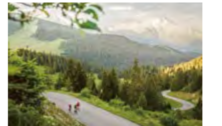
ロース氷河に迫るフルカ峠バスへのヒルクライム

スイスは観光立国として鉄道、バス、湖船、山岳交通機関などが世界一発達している国です。自分の行きたい場所へ自転車と一緒にどこへでも行けるのが大きな魅力です。大きな荷物も次の訪問地までライゼゲベック(別送サービス)にて送ることが可能です。スイストラベルシステムによって、自分が走行してみたい地、見てみたい風景などを自由自在に組み合わせて自分だけの自転車旅を快適につくりあげることができます。困った時や緊急時はスイス現地支店がサポートするので安心です。サイクリングもロードバイク、マウンテンバイク、Eバイクと走行フィールドに合わせて自由自在に楽しむのも良いでしょう。また、自転車を中心に、山岳エリアでは気軽にハイキング、観光スポットも織り交ぜながら旅できるのは、時間に正確な交通機関が整備されたスイス旅行の特権です。