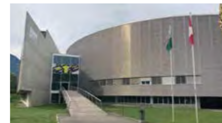
UCI(国際自転車競技連合)のスイス本部がエイグルに重厚に存在しています