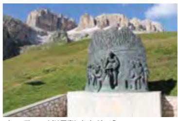
チーマディコッピは写真に収めておこう

距離：約55km、獲得標高1,600m 走行時間：約5時間30分〜6時間（中・上級者向け） *初級者や体力に自信がない方は、Eバイクのレンタルをおすすめします。