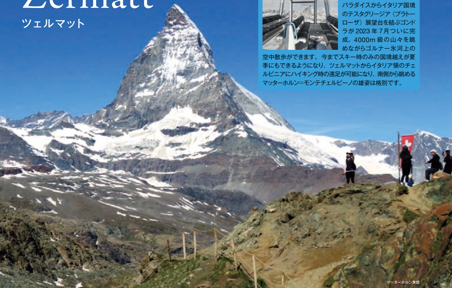
マッターホルン東壁