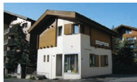
ツェルマット支店：Tel. (027) 967 52 57 Spissstrasse 18, Postfach 466. CH-3920, Zermatt, Switzerland