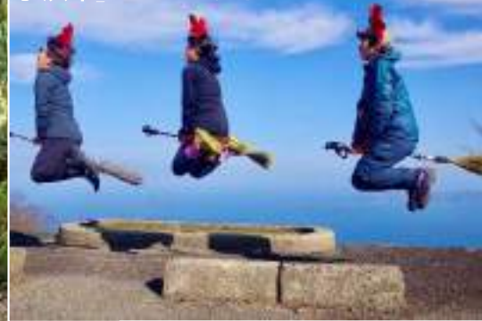
小浜市 エンゼルライン