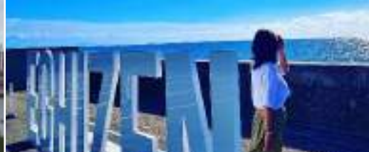
越前町 道の駅越前