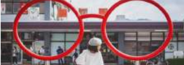
鯖江市 鯖江駅モニュメント