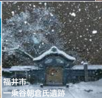
福井市 一乗谷朝倉氏遺跡