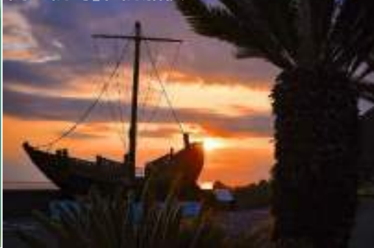
南越前町 北前船模型