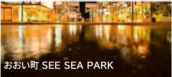
おおい町 SEE SEA PARK