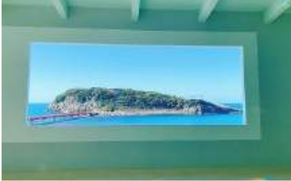
坂井市 Brilliant Heart museum