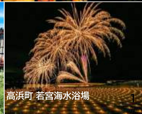
高浜町 若宮海水浴場