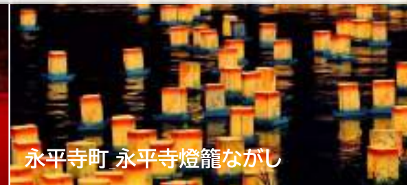
永平寺町 永平寺燈籠ながし