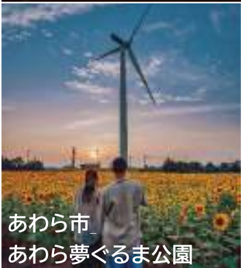
あわら市 あわら夢ぐるま公園