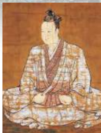
明智光秀肖像画(本徳寺所蔵)

明智光秀(1528?~1582) 日本史上最大の謎「本能寺の変」の首謀者。主君・織田信長を討った逆臣というイメージがあるが、福知山では善政を行った名君として今でも慕われている。