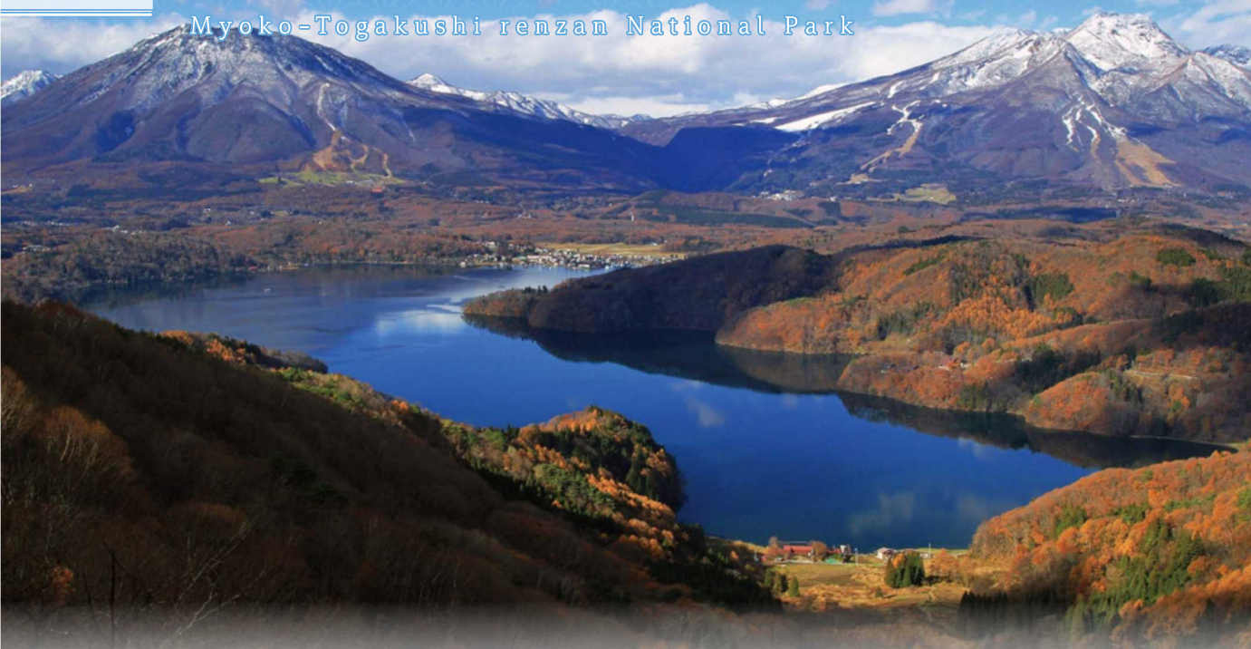
長野県信濃町・菅川林道から望む黒姫山・野尻湖・妙高山