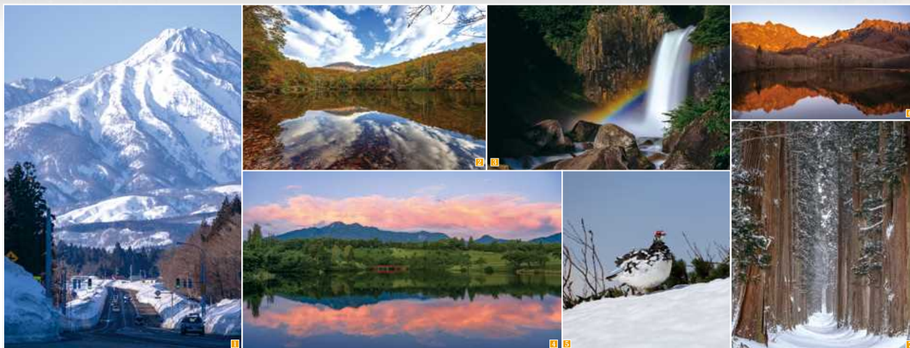
1 新潟県妙高市国道18号から見る妙高山 2 笹ヶ峰高原 3 苗名滝月虹 4 妙高山と朝焼け 5 新潟県妙高市・新潟県糸魚川市 ライオンウ 6 鏡池のモルゲンロート 7 戸隠神社奥社