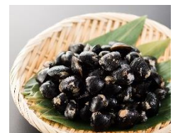
商品例・天塩のしじみ

天塩の自然が育んだ、上品な風味と大粒で濃厚な味は、絶品です。天塩町の特産品「しじみ」をとくとご堪能あれ！