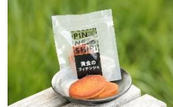
商品例・黄金のフィナンシェ

道北中頓別町産ハチミツ、地元素材使用のスイーツ、北海道のお土産品などなど、お買い物をお楽しみ下さい！