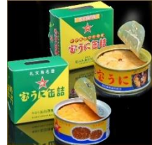
商品例・宝うに缶詰

北海道の北に位置する礼文島は、四方を豊饒な海に囲まれております。一年を通して豊富な海産物が水揚げされます。味、鮮度もトップクラスの産品を産地直送で皆様のもとへお届けいたします。