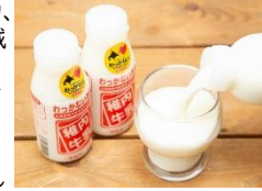
商品例・稚内牛乳

「日本のてっぺん」稚内の豊かな自然で生まれた、農畜産物や水産物、生産される産品や地域資源を「稚内ブランド」として認定し、広く発信することで知名度向上を図っています。ぜひ、稚内自慢の味をお楽しみください。