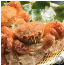
商品例 枝幸産毛ガニ

北海道枝幸町(えさしちょう)が誇る自慢の海産物や山の幸、銘菓などを取り扱う枝幸町特産品ショップです。