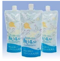
商品例・豊富温泉濃縮水(入浴・肌用)

豊富温泉は皮膚に良いことで知られていますが、遠くからお越しになれないとの声もあり、お役に立ちたいとの思いをこめて作りだしたのが、『豊富温泉濃縮水 サロベツ大地恵泉』です。源泉を7倍に濃縮しています。