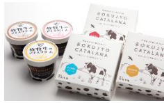
商品例・放牧牛のアイスクリームとカタラーナ

放牧牛の優しい甘みを感じられ、すっきりとした後味のアイスクリューム。優しく混ぜるとジェラートのような触感がオススメです。牛乳の風味がたっぷりと味わえるカタラーナは、柔らかくなってから、一口サイズでお召し上がりください。