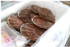
商品例 猿払村の活ほたて

全国でも有数のほたての名産地。厳しい天然の環境で稚貝を撒き、低い水温の地域で育ったほたては甘みと旨みが強く4年をかけて育てられます。その間、順調に成長したほたての海の幸をご賞味ください。