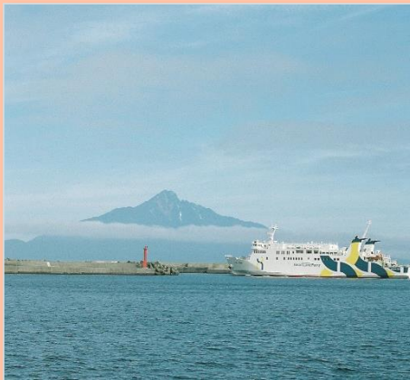
Instagramフォトコンテスト「#私が見つけた宗谷」入賞作品

「宗谷エリア」の 各市町村には、 自慢の逸品がたくさん！ ネットでも買える逸品を ご紹介します。