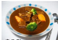
商品例 秘境牛ビーフシチュー

北海道幌延町で育てられるホルスタインのうち、経産牛(子を産んだ牛)を肉牛として4か月以上肥育したものを「秘境牛」と呼んでいます。牧草自給100%、和牛用の飼料を使って育てており、肉質の向上を図っています。ぜひ召し上がってみて下さい！