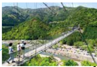
▲谷瀬の吊り橋 長さ297m、高さ54mの生活道として公道(村道)の認可を受けた日本一長い鉄線の吊り橋