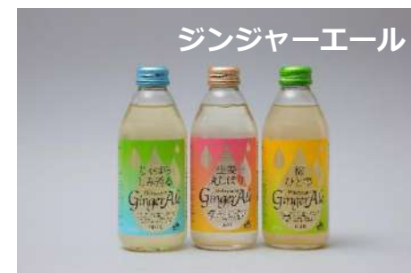
ジンジャーエール