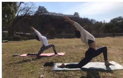
和歌山城で朝ヨガ体験