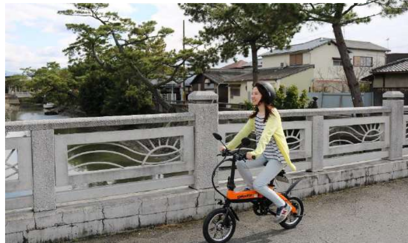
次世代バイクglafitレンタル体験