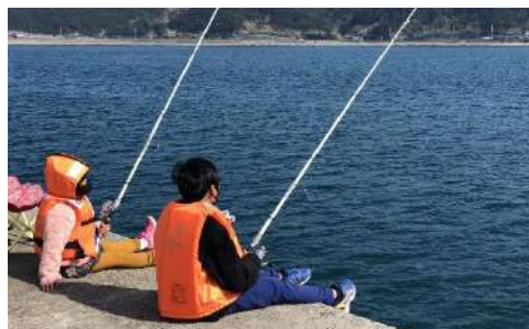
手ぶらで簡単海釣り体験