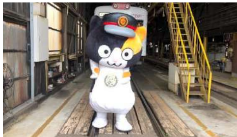
和歌山電鐵車両点検場見学