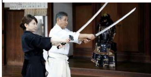
紀州伝承田宮流居合術の 実技体験