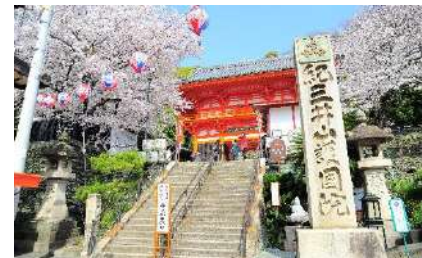
日本遺産・紀三井寺