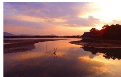
日本遺産・和歌の浦