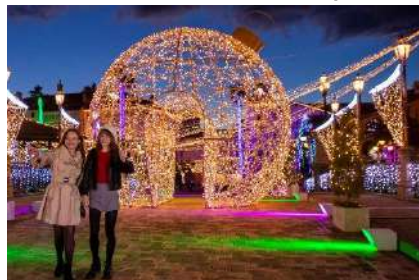
マリーナシティ (フェスタ・ルーチェ)