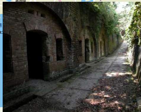
↑友ヶ島の砲台跡 アニメ「サマータイムレンダ」→