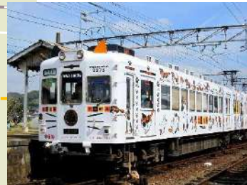
わかやま電鉄貴志川線