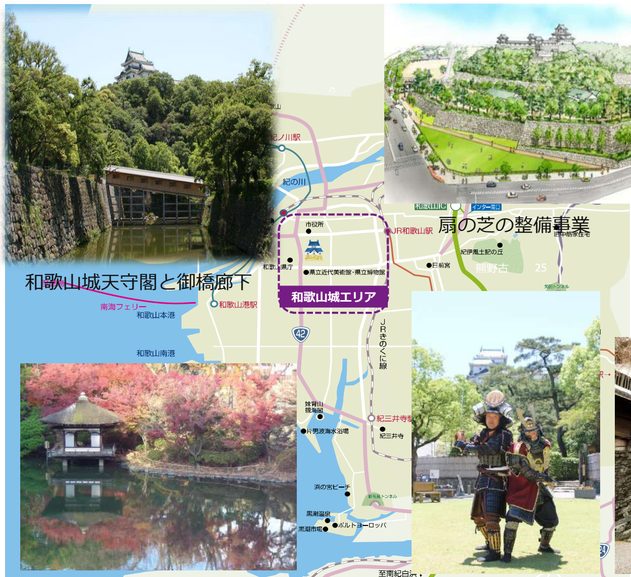
和歌山城天守閣と御橋廊下