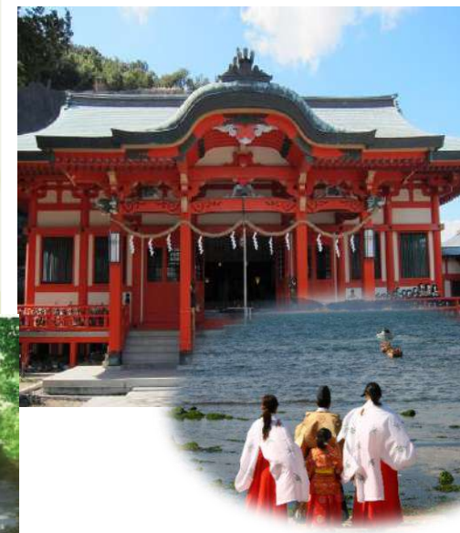
淡嶋神社の雛流し