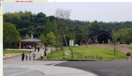
道の駅 四季の郷公園 『FOOD HUNTER PARK』