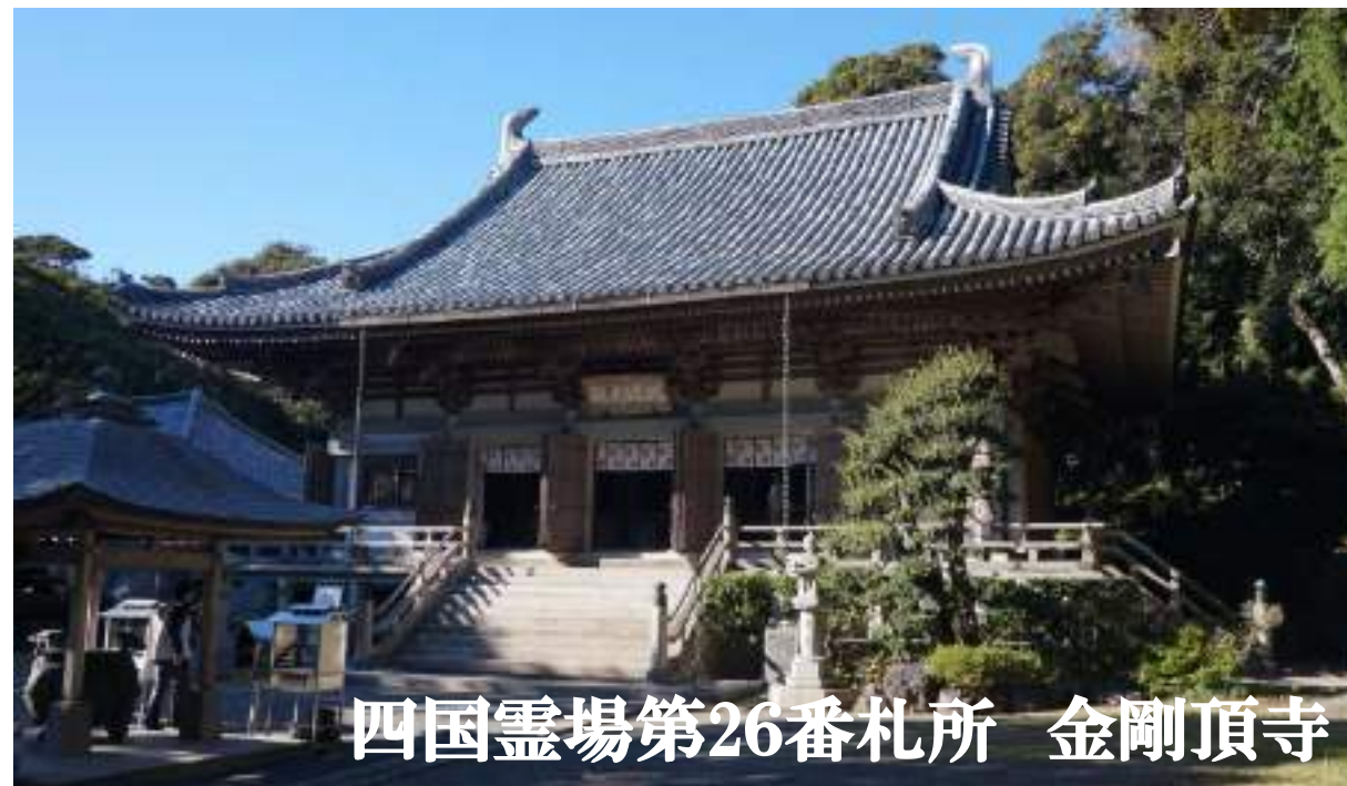
四国霊場第26番札所 金剛頂寺