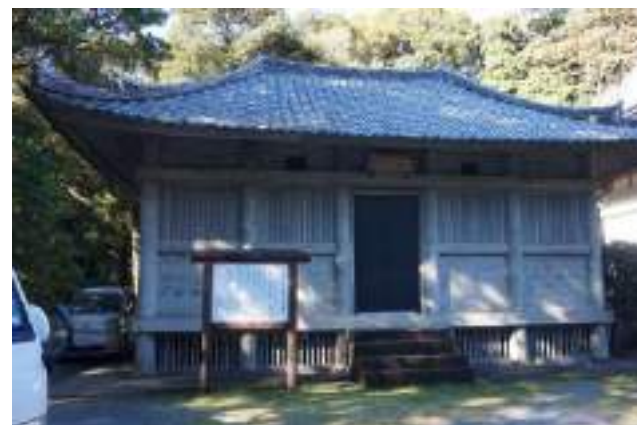
境内にある霊宝殿

空海ゆかりの唯一の品《金銅旅檀具》や平安末期の寄木造りの本造阿弥陀如来像など多くの国の重要文化財を特別に拝観できます