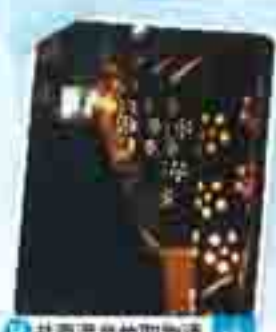
盐原温泉竹取物语 14