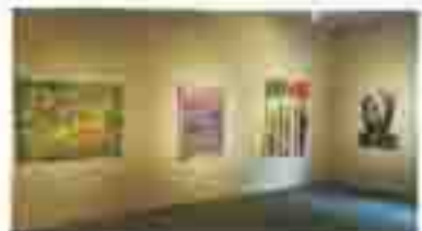
展览入口 可欣赏到艺术作品，在这里

茶器展览 展示伊豆半岛制作的茶器展览，包括日式碗、茶碗、茶托等。展览时间: 周二 - 周日 (11月19日~12月31日) TEL: 0287-346700