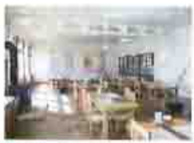
北川美术馆 由旧产田小学改建而成的展览空间，作为对艺术事业的推广，提供展览、讲座、研讨会、工作坊等。展览时间: 周二 - 周日 (11月19日~12月31日) TEL: 0287-33-0700