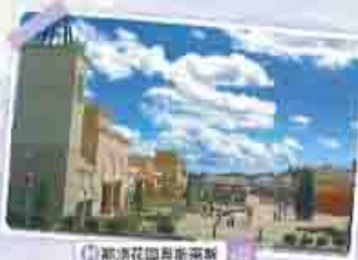
欧洲花园奥米雷斯 111