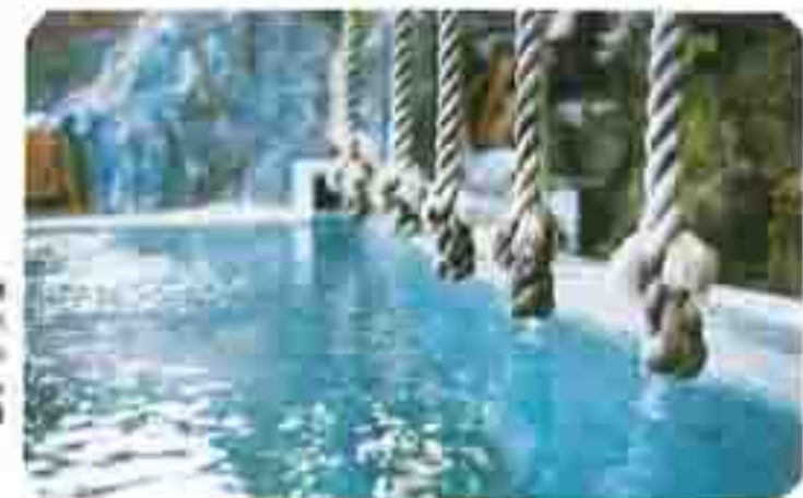
北见市天正村 幸丸温泉 TEL: 0997 66 11 00

温泉一直是北见市引以为傲的旅游资源。据史料记载，从江户时代开始在温泉中浸泡可以温暖整个身体，不仅能够驱除寒气，还能缓解疲劳。因此深受好评，因为具有优良的温泉资源基础。1971年被北见市指定为“国民保養温泉地”。