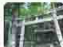
板室温泉神社 ※火灾、财运治愈祈愿

【一】板室温泉—温泉神社— 那須野原温泉除了那須野原神社的社址的温泉外，还有另外两处。“三大祈愿”是于温泉都有灵验。