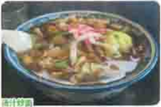
酱汁炒面 当地特产的酱汁，经过100℃的高温熬制而成。将香滑的面条和鲜美的酱汁搅拌均匀，即可享用。 那须 0287-35-9144 那须牧场 0287-7119-1519