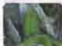
水之原池温泉 ※母子祈愿