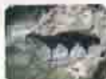
茨野神社“洞窟” ※恋爱治愈祈愿