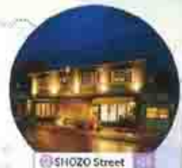
SHOZO Street 111